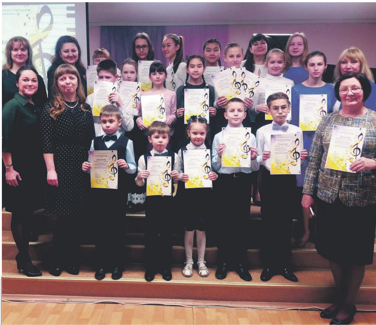
Преподаватели и ученики