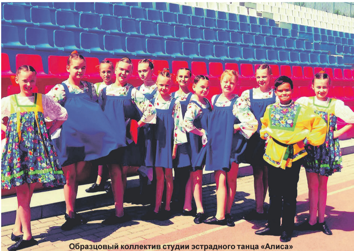
Образцовый коллектив студии эстрадного танца «Алиса»