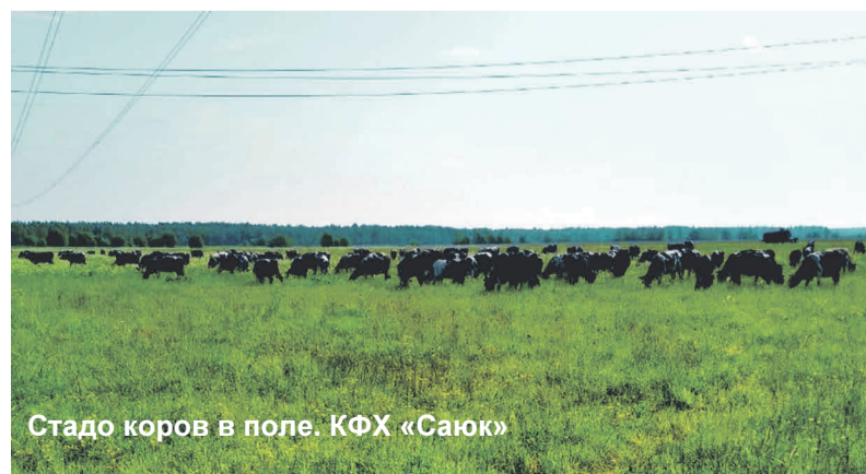
Стадо коров в поле. КФХ «Саюк»

«Много функций выполняет почта России, в особенности на селе. Сейчас очень актуальна услуга для пенсионеров – вызов почтальона на дом. С помощью неё пожилые люди могут приобрести продукцию, произвести оплату коммунальных услуг, оформить подписку на газеты и журналы. Почтальон всегда носит с собой мобильную кассу, с помощью которой выдаёт документ об оплате. Помимо этого, активно работает услуга пересылки посылок. Чтобы не стоять в очереди, клиент может из дома оформить заказ в электронном виде, что очень удобно. Наше почтовое отделение обслуживает все деревни Загривского поселения – это более чем четырёхста адресов. В период карантина мы работаем по обычному графику, но пенсия в режиме строгой самоизоляции доставлялась на дом. Сейчас пожилые люди уже могут прийти на почту, но с условием соблюдения всех мер безопасности – они должны быть в масках и перчатках. На сегодня обслуживание населения усовершенствовано, работать стало намного проще. Значительно упростилось и заполнение документов – мы клиентов регистрируем один раз, а в дальнейшем все данные компьютер выдаёт автоматически, требуется всего лишь подпись», – проинформировала нас о работе Загривского почтового отделения начальник отделения почтовой связи Надежда Боханова .