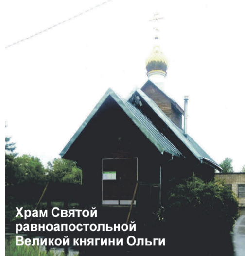
Храм Святой равноапостольной Великой княгини Ольги