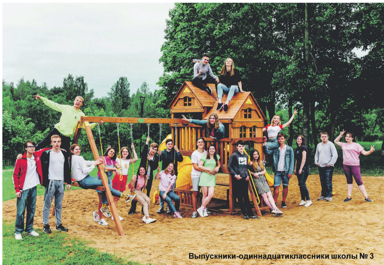
Выпускники-одиннадцатиклассники школы № 3

Многие ругают карантин! Самая, на мой взгляд, известная интернет-цитата последних двух месяцев: «Високосный год удался: зима без снега, крещение без проруби, Пасха без церкви, школа без учеников, работа без работника, день рождения без гостей, парад без ветеранов...» – в продолжение цитаты обсуждения на разных сайтах и форумах, какие «бедные» выпускники – остались без праздника Последнего звонка и без выпускного.