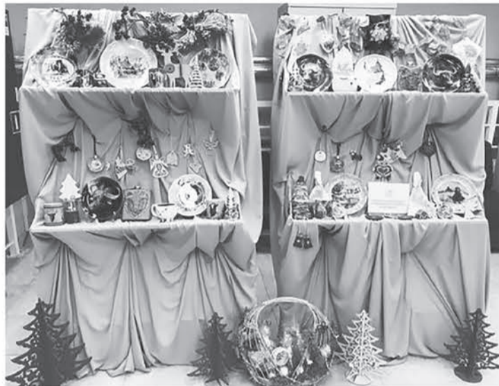
Образцы продукции особенных ремесленников