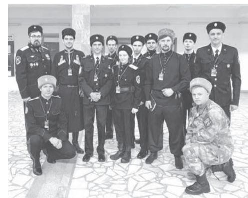
Казаки из Ленобласти на II Всероссийском слете казачьей молодежи в Красноярске