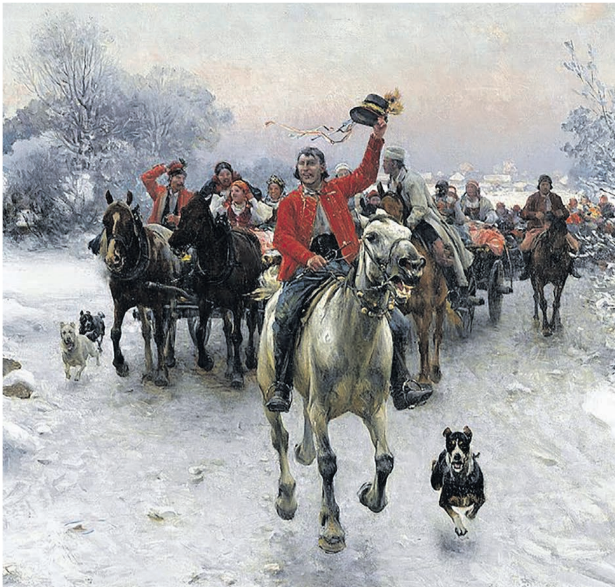
А. Ковальский-Веруш. Свадебный поезд

Получив благословение родителей, они целуются и едут в церковь на одних санях. Впереди едет дружка и очищает дорогу; всем встречным жених и невеста кланяются в пояс. За ними мчится весь поезд и сзади везут сундук с именем невесты. Молодые входят в церковь в шерстяных перчатках, а невеста – покрытая платком, и если она сирота, то – с распущенною коною.