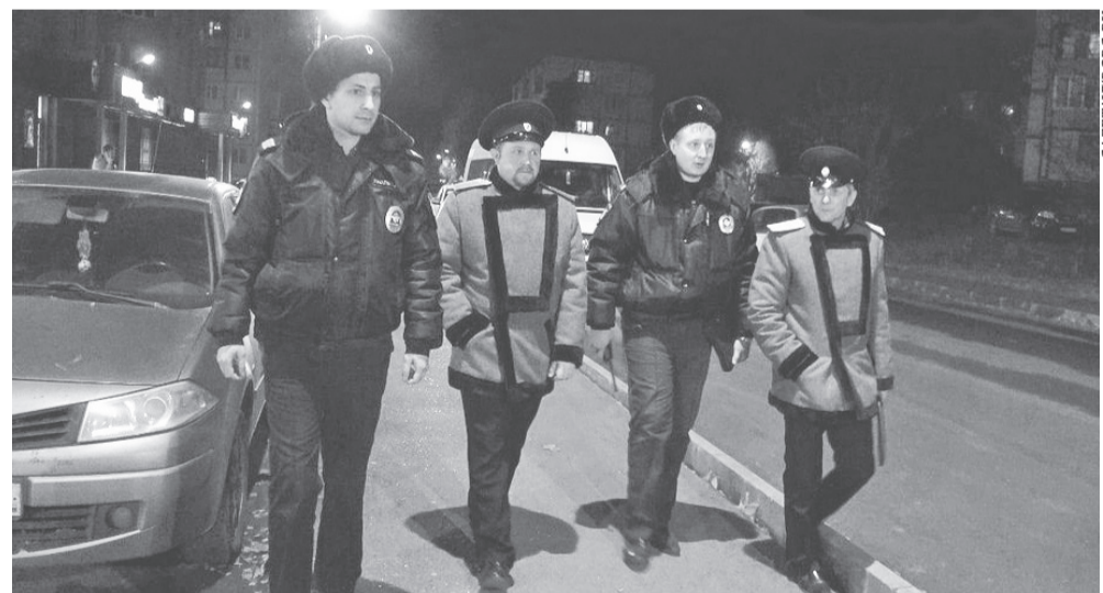
Выборгские казаки во время рейда

Казачество готово активнее участвовать в обеспечении общественного порядка в регионе.