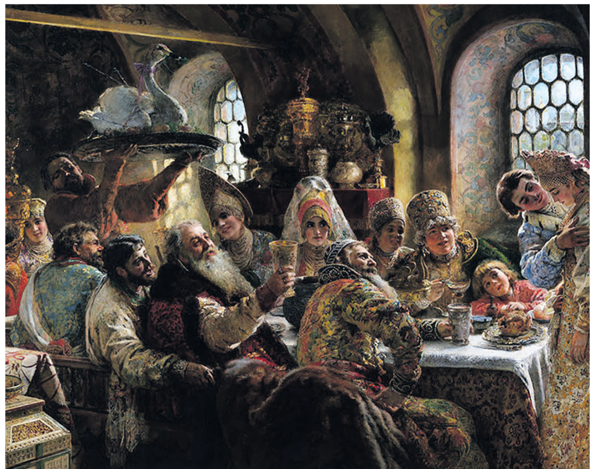
К. Е. Маковский, «Боярский свадебный пир»

Д.С. Лихачев писал: «Любовь к родному краю, знание его истории – основа, на которой только и может осуществляться рост духовной культуры всего общества». По-настоящему любить свою страну способен тот, кто любит малую родину. Изучение истории родного края позволяет нам не превратиться в «Иванов, не помнящих родства».