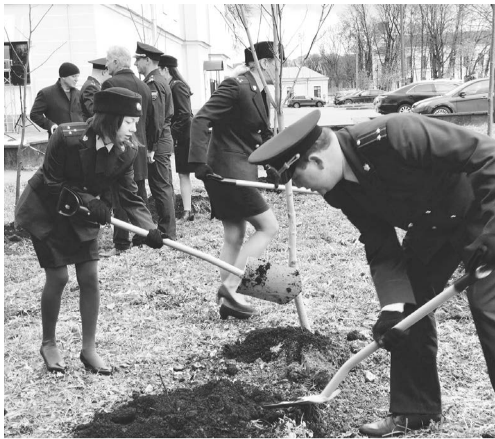
Этой осенью возле Гатчинского Дома культуры к 300-летию создания российской прокуратуры была высажена Аллея героев — 30 лип и кленов

регион обеспечил благоустроенным жильем более 1500 детей, направив на это порядка 3,5 млрд рублей.