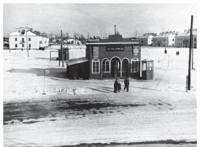
Вид улицы Ленина от пересечения с улицей Кирова 1950-гг