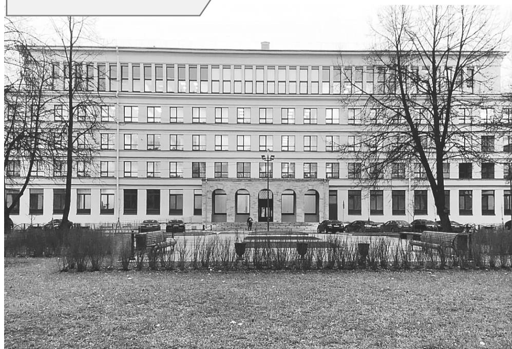
Прокуратура Ленинградской области (Санкт-Петербург, Торжковская ул., 4)

ЗА 11 МЕСЯЦЕВ 2021 ГОДА ПОСТУПИЛО В ПРОКУРАТУРУ ЛЕНИНГРАДСКОЙ ОБЛАСТИ.