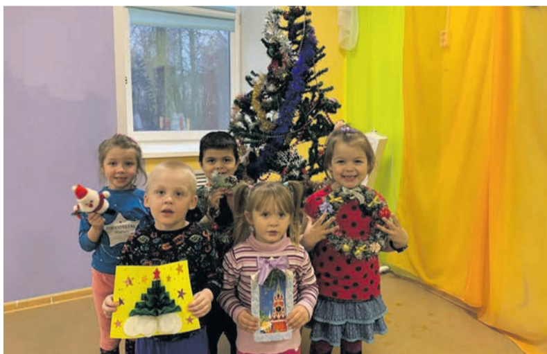
Ребята стационарного отделения центра «Мечта» присоединились к акции «Твори добро». Совместно с педагогами изготовили поздравительные открытки к Новому году