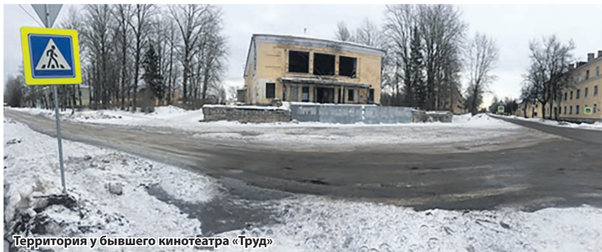
Территория у бывшего кинотеатра «Труд»