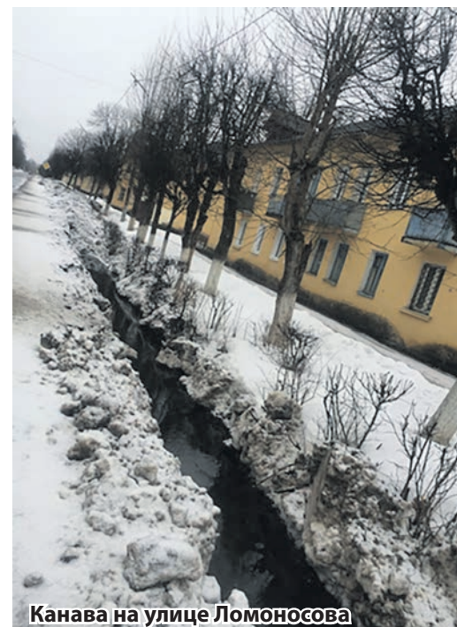
Канавы на улице Ломоносова