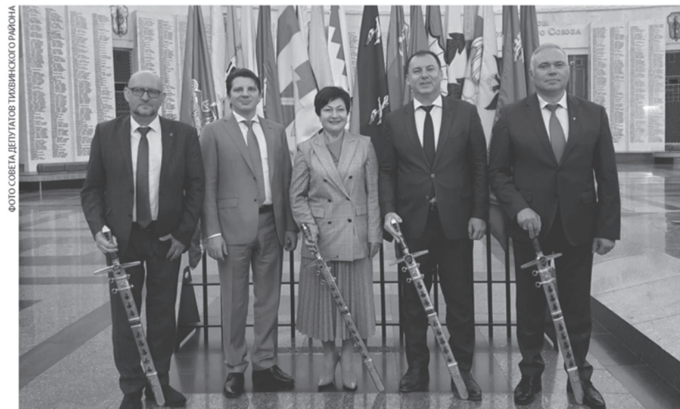
ФОТО СОВЕТА ДЕПУТАТОВ ТИХВИНСКОГО РАЙОНА

усте. Оружие покрыто золотом высшей пробы и инкрустировано гранатом, символизирующим пролитую кровь, а также голубым топазом — символом мира. Длина клинков составляет