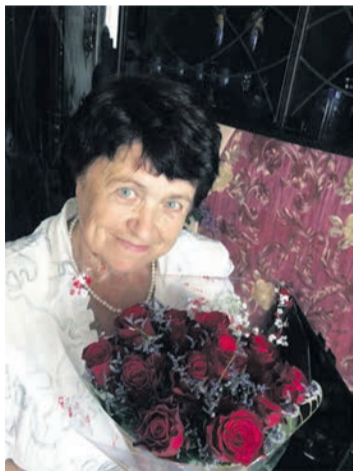
Дети, внуки и правнучек!

Пусть будет крепким твое здоровье, счастливым взгляд и добрым сердце. Мы тебя очень любим, ценим и бережем! С днем рождения, родная!