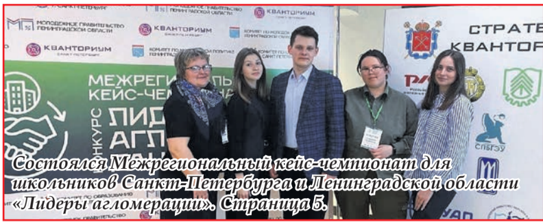
Состоялся Межрегиональный кейс-чемпионат для школьников Санкт-Петербурга и Ленинградской области «Лидеры агломерации». Страница 5.