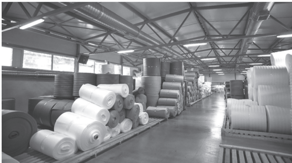
■ «Полифас» производит в год порядка 3-4 тысяч тонн полиэтилена, 4-5 млн кв. метров рулонной продукции, более 1 млн километров теплоизоляционных труб

Лидирует «Полифас» не только в производстве, но и