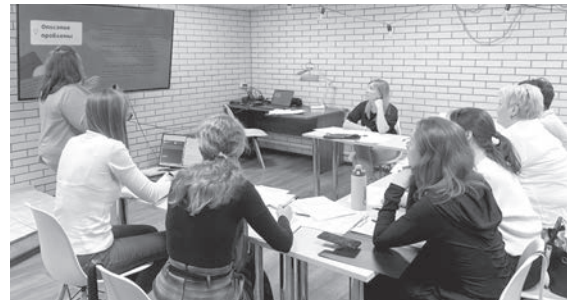
Авторы волонтерских проектов регулярно устраивают обсуждения лучших практик, помогают друг другу

– Название проекта появилось в 2019 году, когда мы впервые создали сообщество волонтеров-аниматоров. «АниМы» – значит «Аниматоры+Мы». Сейчас я испытываю радостное предвкушение. С нашей помощью заинтересованные ребята поймут, что приносит радость и веселье детям, лишённым этих эмоций в жизни. На средства гранта мы сможем приобрести оборудование и реквизит, провести серию праздников для детей, попавших в трудную жизненную ситуацию. А ещё мы мечтаем масштабировать наш проект за пределы Всеволожского района.