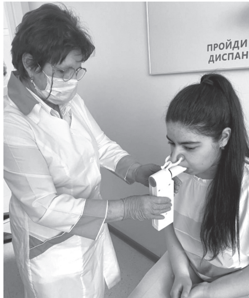
Спирометрия позволяет оценить состояние лёгких после коронавируса

– А как обстоят дела с диспансеризацией? Она ведь особенно важна для перенёсших COVID-19?