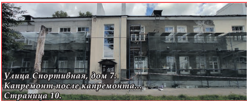
Улица Спортивная, дом 7. Капремонт после капремонта... Страница 10.