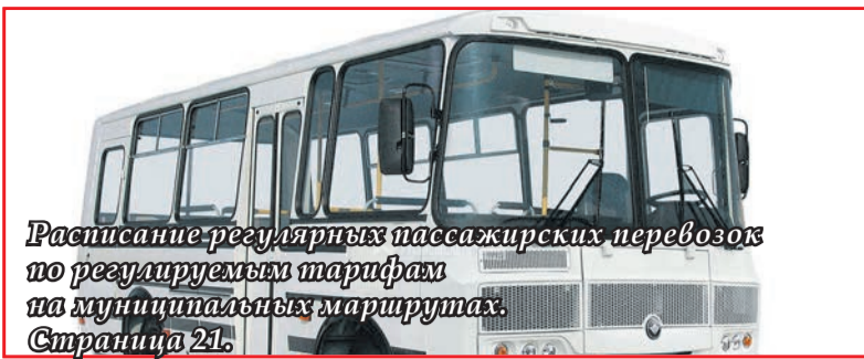
Расписание регулярных пассажирских перевозок по регулируемым тарифам на муниципальных маршрутах. Страница 21.