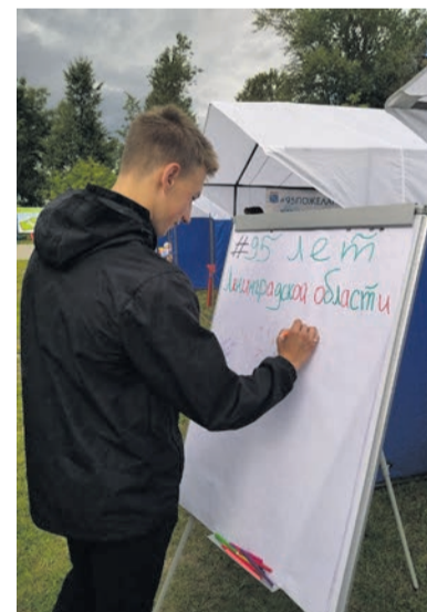
Продолжение на странице 2.