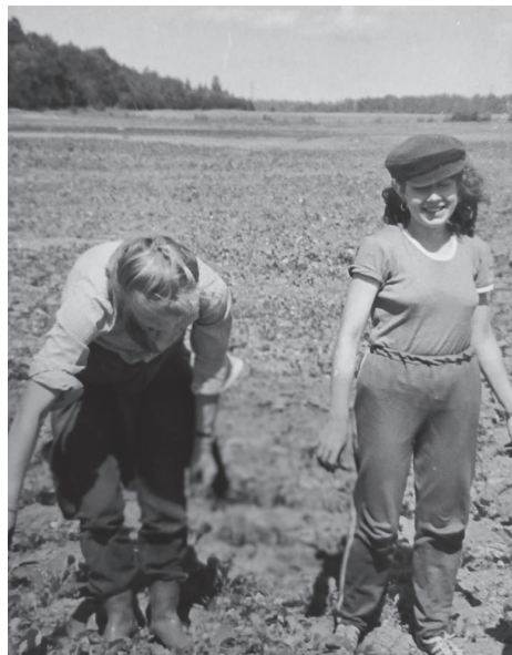
Д Коллективные выезды на уборку картофеля