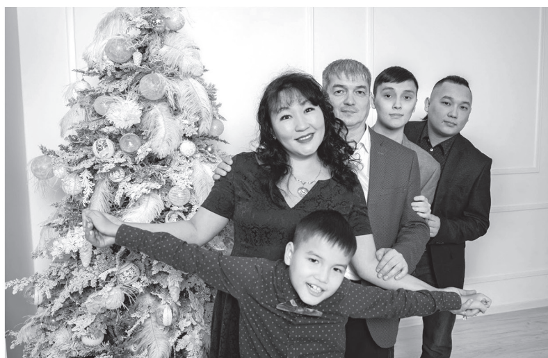
Хранители педагогических традиций — семья Юзвик из Мурино

АЛЕКСЕЙ АСТАПЧИК