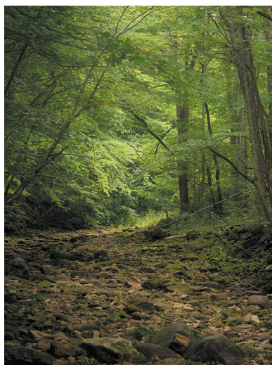
■ Рагуша, Бокситогорский район

Тропа расположена в государственном природном заказнике, который называется так же — «Раковые озёра». Три озера — Большое Раковое, Малое Раковое и Охотничье — неглубокие и хорошо прогреваемые, в их водах много органических веществ, а по периметру — большое количество тростника и других растений. Скорость образования болот здесь намного больше, чем в других экосистемах. Эти предпосылки создают отличную кормовую базу для различных водоплавающих и околоводных птиц, многие из которых занесены в Красные книги России и Ленинградской области. Для удобства маршрут «Раковые озёра» оборудован протяжёнными настилами, также есть смотровые вышки. Протяжённость тропы составляет около 8 километров.