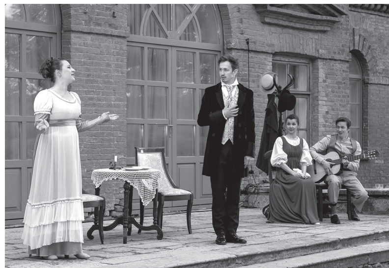
Усадьбы и замки Ленобласти становятся декорациями для постановок театра

театра» мы включили многие аспекты и направления, сферы бытия театра.