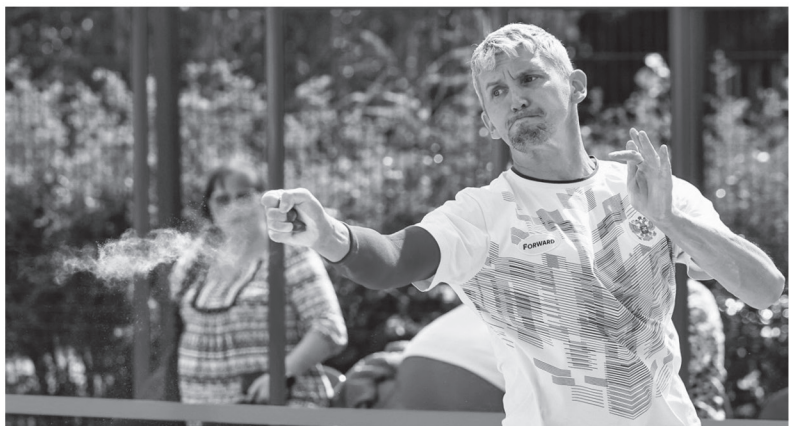
Чемпионат Европы по городошному спорту объединил атлетов из разных стран

БЕСЕДОВАЛ СТАС БУТЕНКО