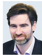
ДМИТРИЙ ЯЛОВ, ЗАМПРЕД ПРАВИТЕЛЬСТВА ЛЕНИНГРАДСКОЙ ОБЛАСТИ, ПРЕДСЕДАТЕЛЬ КОМИТЕТА ЭКОНОМИЧЕСКОГО РАЗВИТИЯ И ИНВЕСТИЦИОННОЙ ДЕЯТЕЛЬНОСТИ

Задача властей Ленобласти — предложить максимально качественные условия для туристов, чтобы не разочаровать путешественников, заручиться их лояльностью и рассчитывать на возвращение.