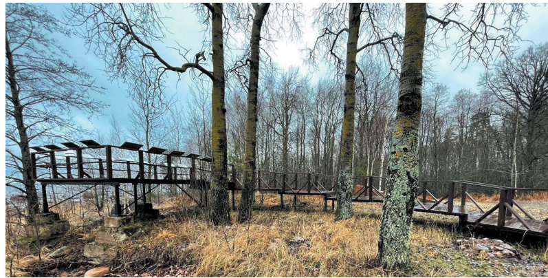
■ Мыс Кипперорт, Выборгский район

Почти треть тропы оборудована настилами и мости-