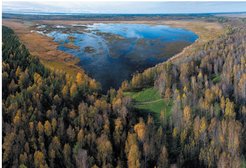
■ Раковые озёра, Выборгский район