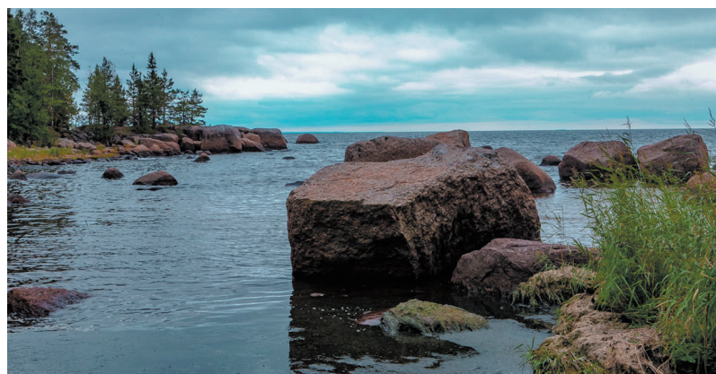
■ Каменистая тропа, Выборгский район

На сегодняшний день все 47 экологических маршрутов, заявленных в проекте «Тропа47», введены. Далее мы будем поддерживать в рабочем состоянии уже построенную инфраструктуру, создавать комбинированные маршруты, чтобы была возможность на одной территории, в зависимости от уровня подготовки, пройти более длинные расстояния. Для снижения антропогенной нагрузки очень нужны организованные стоянки, информационные щиты и другая полезная инфраструктура.