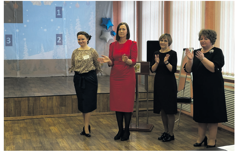
Δ Участницы конкурса «Учитель года-2024»