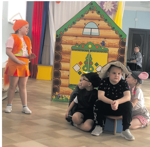
Δ Сказка «Под грибом», группа № 8