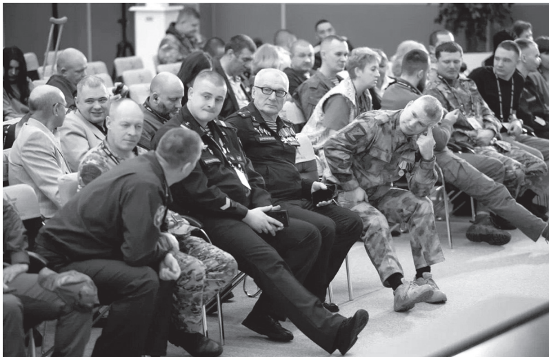
Участники Ассоциации ветеранов специальной военной операции Ленинградской области

ОБЩЕСТВЕННЫЕ ОРГАНИЗАЦИИ ЛЕНИНГРАДСКОЙ ОБЛАСТИ ПОДДЕРЖИВАЮТ УЧАСТНИКОВ СПЕЦОПЕРАЦИИ И ИХ СЕМЬИ