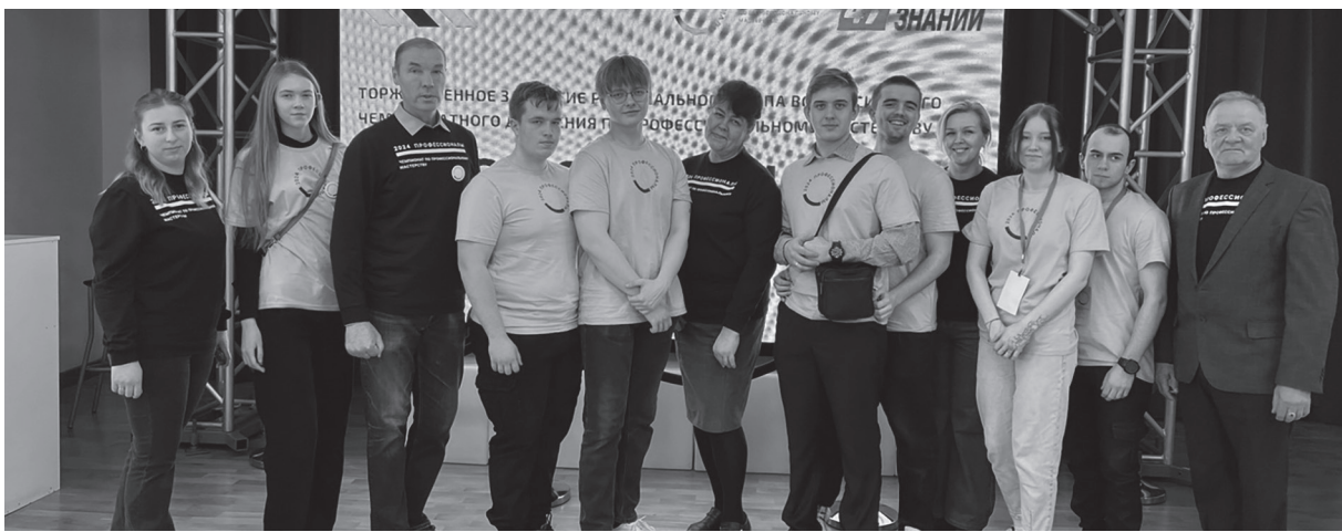
Д Делегация Сланцевского индустриального техникума на чемпионате «Профессионалы»

Основная группа соревновалась в блоках компетенций: производство и инженерные