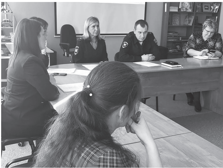
Д Участники «круглого стола», посвящённого проблеме детской дорожной безопасности