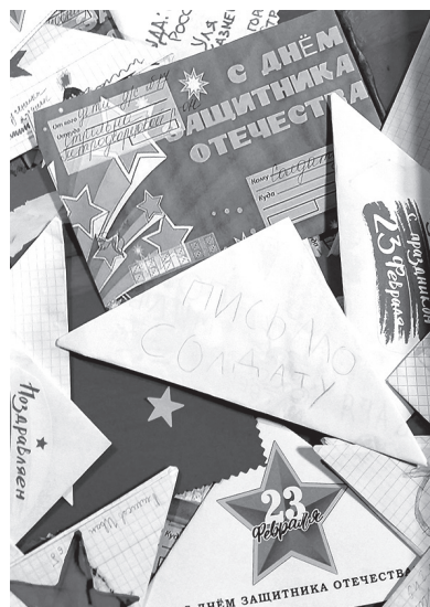
Письма бойцам от детей Ленобласти