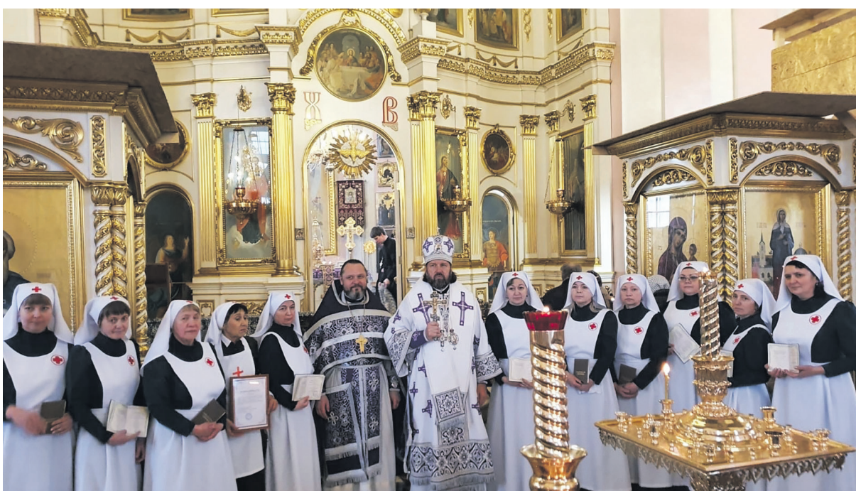
Д Вручение свидетельств сёстрам милосердия

Надо отметить, что сестра милосердия – это профессия, появившаяся в России во второй половине XIX века и долгое время вдохновлявшая на добрые дела женщин разных сословий. Впервые в России сёстры, обладающие не только медицинскими, но и духовными знаниями, вышли на службу в годы Крымской войны. Случилось это в 1854 году благодаря великой княгине Елене Павловне, которая учредила Крестовоздвиженскую общину сестёр милосердия. Обучением девушек, служивших в госпиталях осаждённого Севастополя, занимался учёный и хирург Николай Пирогов.