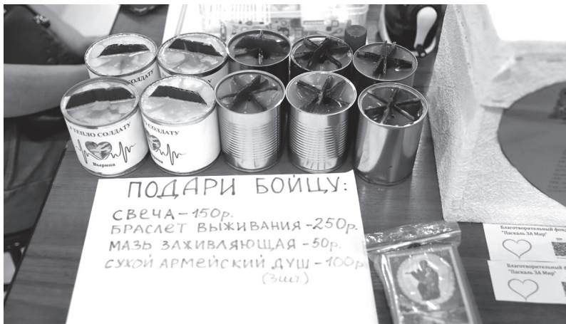
Благотворительная ярмарка в поддержку защитников Отечества в п. Новоселье