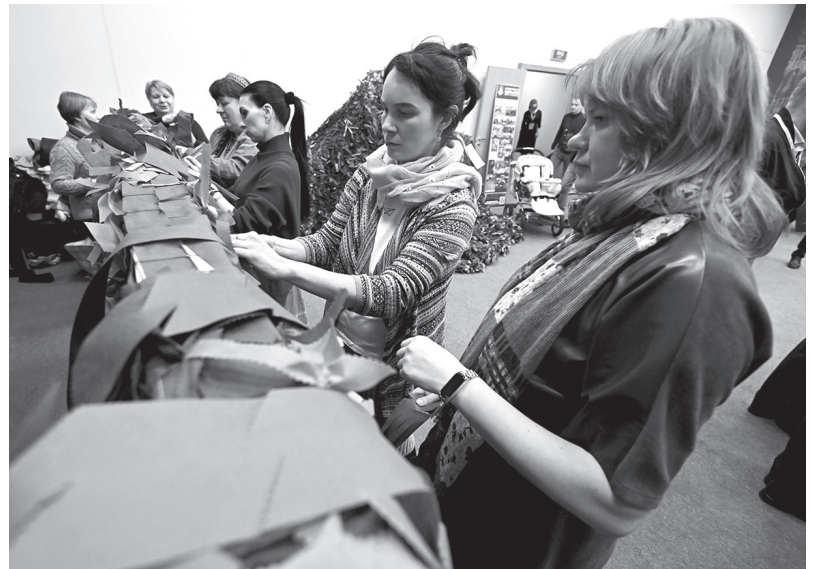
Женщины на мастер-классе по изготовлению маскировочных сетей