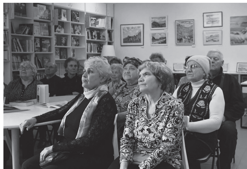
Материалы подготовила Татьяна КРЫЛОВА.

Именно здесь он написал многие свои известные произведения – «Ночь перед Рождеством», «Нос», «Шинель» и другие. Участники виртуального путешествия с удовольствием погрузились в атмосферу гоголевского Петербурга.