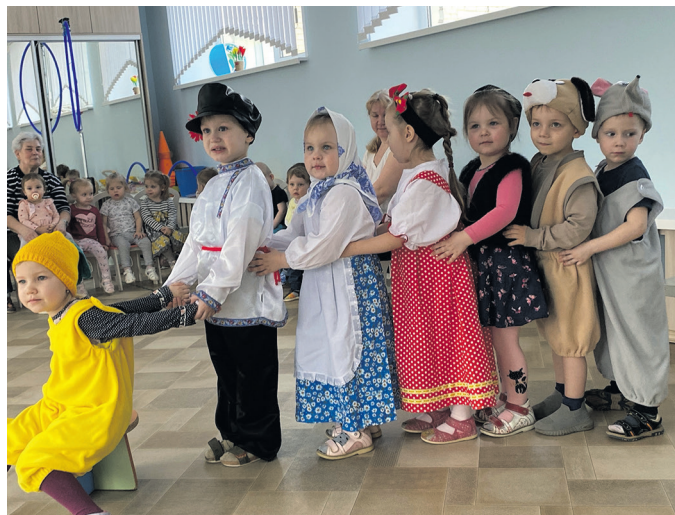
Δ Малыши группы № 3 показали сказку «Репка»

В детском саду № 10 прошёл театральный фестиваль. Атмосфера радости, творчества царил в дошкольном учреждении. Маленькие артисты показывали друг другу замечательные театрализованные представления.