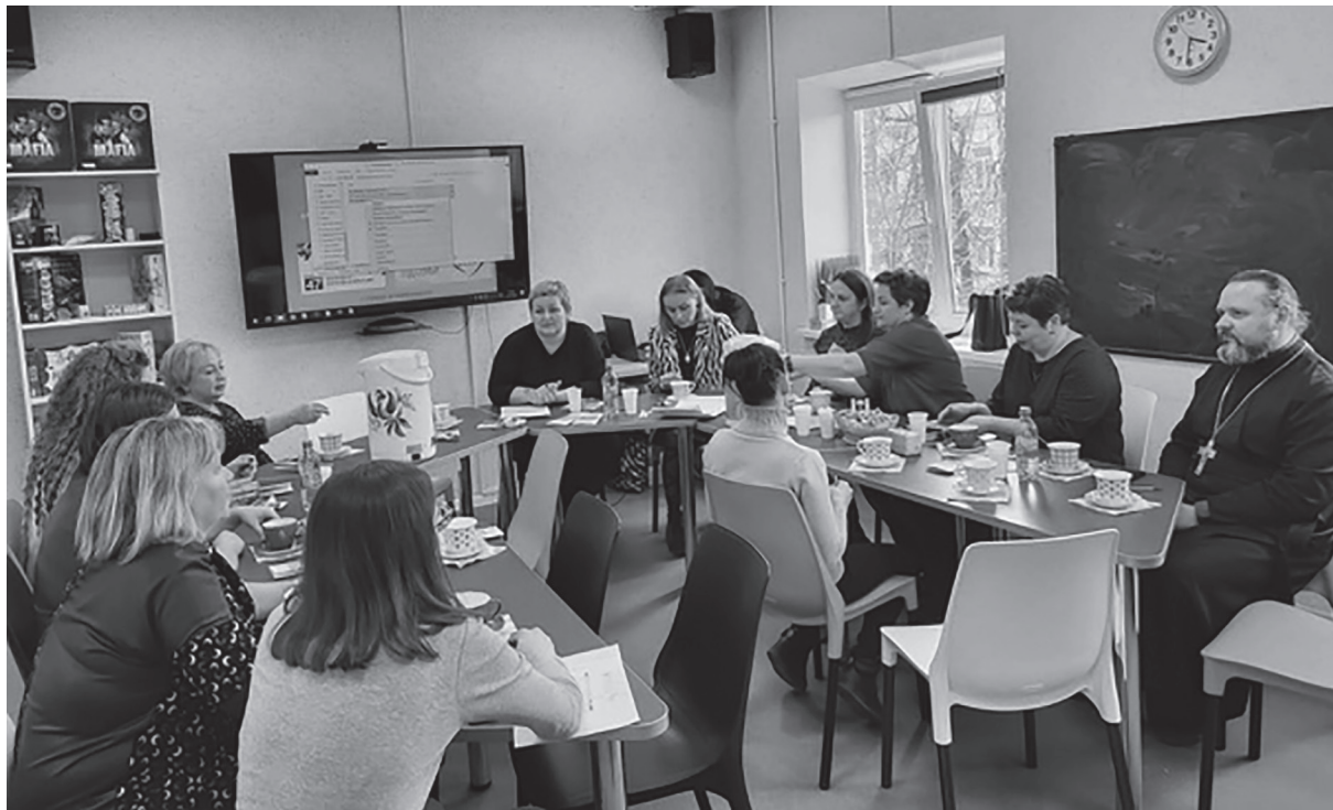
Д Круглый стол на тему «Семейный клуб: пути взаимодействия с местным сообществом»

«Система взаимодействия клуба с местным сообществом будет развиваться, – подчер-