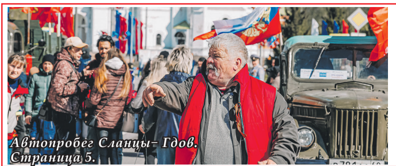
Автопробег Сланцы-Гдов. Страница 5.