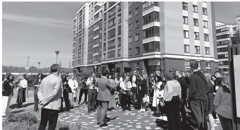
Для участников конференции провели экскурсию по новым районам Новоселья

Лучшие концепции градостроительного развития и социально-