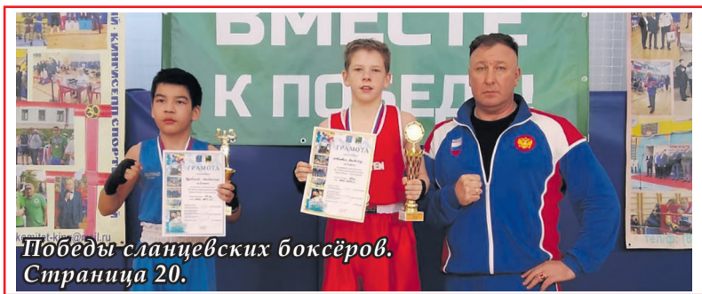
Победы сланцевских боксёров. Страница 20.