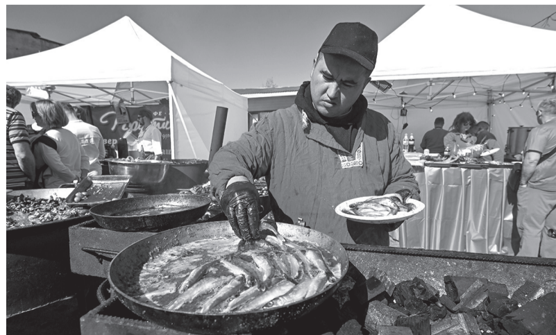
Масло, мука, соль — простой рецепт корюшки по-ленинградски

Благодарю собеседника за рассказ и удаляюсь с фирменным бумажным кулём, полным жареной корюшки. Спешу познакомиться с другими площадками фестиваля — в 2024 году его территория значительно увеличилась. Организаторы подключили к мероприятию новые городские пространства, рестораны и даже музейные площадки. Причина — в популярности проекта. То, что праздник корюшки будет расширяться, стало понятно годом ранее, когда в Новую Ладогу впервые приехали рекордные 27 тысяч туристов. В этом году посетителей было ещё больше, однако места и угощений хватило всем.