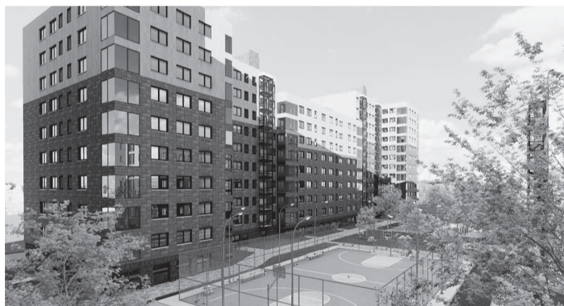
Этот дом студенты спроектировали с применением искусственного интеллекта

КСЕНИЯ БОНДАРЕНКО