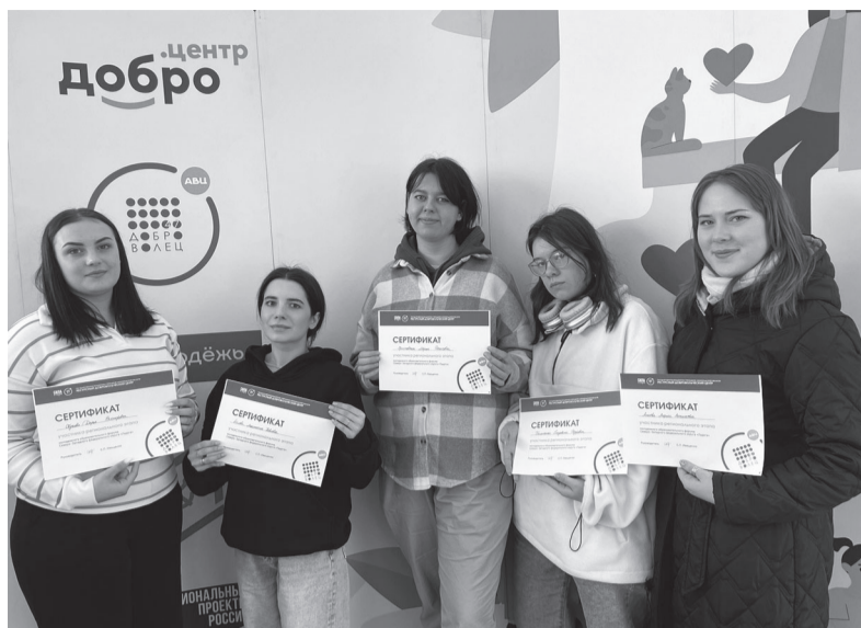
Δ Сланцевская делегация на форуме «Ладога»

Молодые люди смогут пройти обучение на одной из выбранных площадок: продюсерский центр «Вдохновляем», киномастерская «Создаём», историко-патриотическая пло-