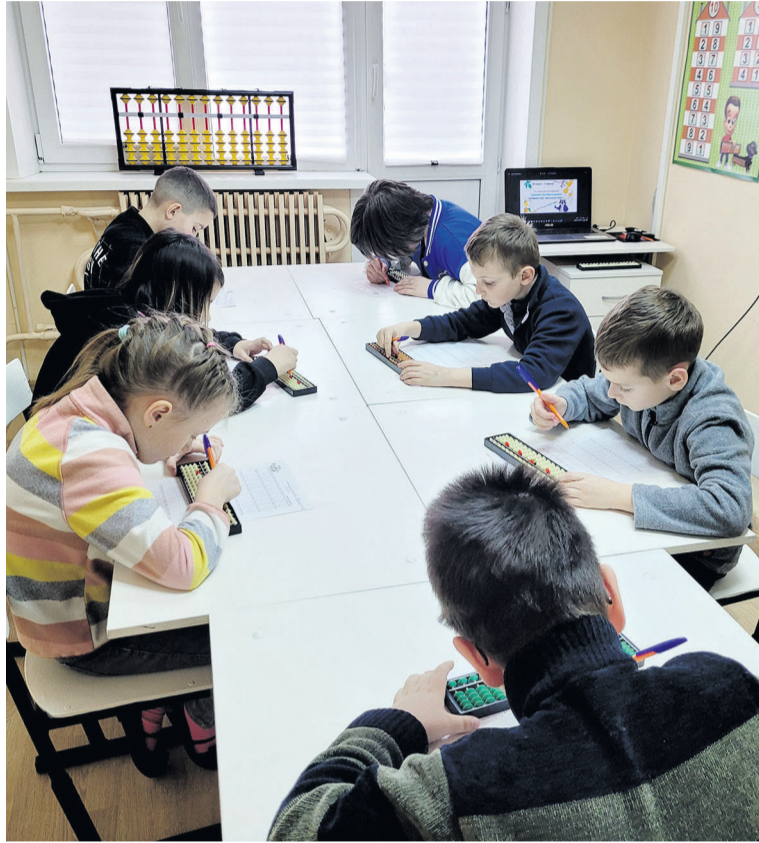
Д Занятие в студии развития детского интеллекта «МА.С.КА»

В студии развития детского интеллекта «МА.С.КА» дети изучают ментальную арифметику, скорочтение, учатся красиво писать.