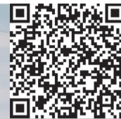
Δ Фото автопробега

буквально впечатлило. Знакомая с ним, понимаешь, какие здесь были бои, сколько пролито солдатской крови, сколько было задействовано родов войск: здесь похоронены лётчики, моряки, пехотинцы. Не только русские, но и представители многих республик Советского Союза. Даже имя испанского лётчика в паре с русским выгравировано на гранитной плите. Венчает мемориал памятник на постаменте русскому солдату с автоматом в руках, устремлённому в бой с фашистами.