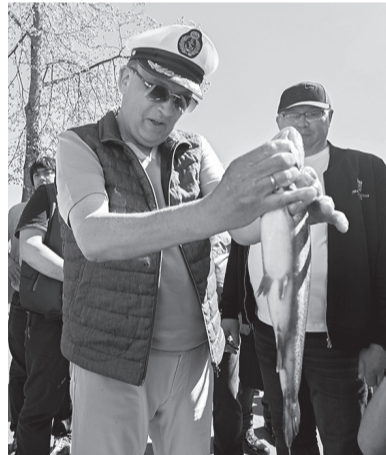
Александр Дрозденко оценил улов рыбаков

Выбираю для себя знакомство с «супом Петра Великого». Считается, что этот аналог рыбной солянки особенно ценил первый русский император. Тогда в навар входил хвост осетра, мясо окуня и угря, перетёртые шампиньоны и даже тефтели из фазана, а бульон готовили на кипятке с добавлением шампанского. Приправлять суп следовало мускатным орехом, лавровым листом, гвоздикой, лимонным соком и анчоусами. Однако в Новой Ладогe гостей учили более доступному рецепту — вместе с опытными поварами мы готовили капустные щи со сметаной. Полкилограмма сушеной корюшки, килограмм картофеля, два стакана молока, луковица и столовая ложка