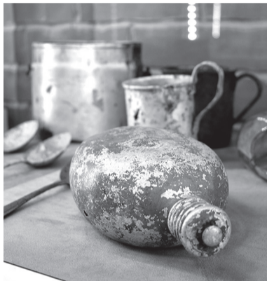
Экспонаты школьного музея в Лагодово

В музее часто проводятся мастер-классы, встречи с краеведами и ветеранами Великой Отечественной войны.