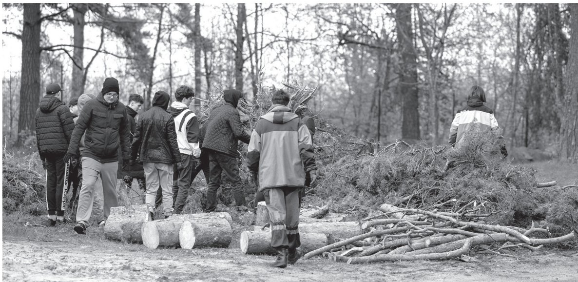
Участники «Ладожского десанта» делают добрые дела в районах Ленобласти

— Проект «СИМ БЕЗОПАСНОСТИ» существует уже более 10 лет. За это время мы посетили практически все районы Ленинградской области, получили письма поддержки от школ, у нас сложились добрые отношения с ГИБДД. В ближайшее время запланированы мероприятия в Тосненском,