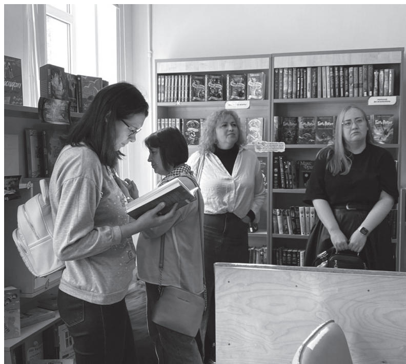
Δ Группа методистов библиотек Санкт-Петербурга знакомится с библиотекой в Лучках

Также незаменимым элементом программы стал разговор о творческих выставках, которые регулярно проводятся в библиотеке. Эти выставки помогают раскрывать местные таланты, способствуя культурному развитию сообщества. Методисты отметили, что подобные инициативы не только обогащают культурную жизнь библиотеки, но и способствуют вовлечению местных жителей и детей в чтение и искусство. Работа библиотекарей была ещё одной темой, обсуждаемой в ходе визита. Участники отметили высокий уровень профессионализма и творческий подход местных сотрудников, которые находят индивидуальные подходы к каждому читателю и активно привлекают молодое поколение к культуре чтения. В завершение встречи методисты выразили благодарность за тёплый приём. Это сотрудничество послужит