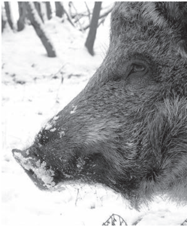
Дикие свиньи живут в Ленобласти с 1947 года