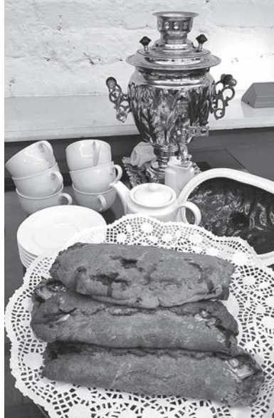
Знаменитый рыбник из Шлиссельбурга

подготовил Музей истории города Шлиссельбурга — «Гастрономический вояж».