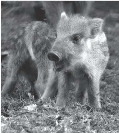
Кабаны — самые плодовитые животные среди копытных

О присутствии этих животных в лесу мы узнаём по участкам земли, которые перепаханы, словно трактором. За день один кабан при помощи своего ловкого и сильного рыла может вспа-