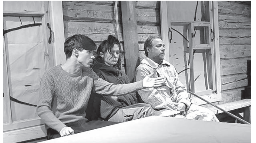
В Выре сцену артистам заменило пространство деревянного дома

АЛЕКСАНДРА СИДОРОВА