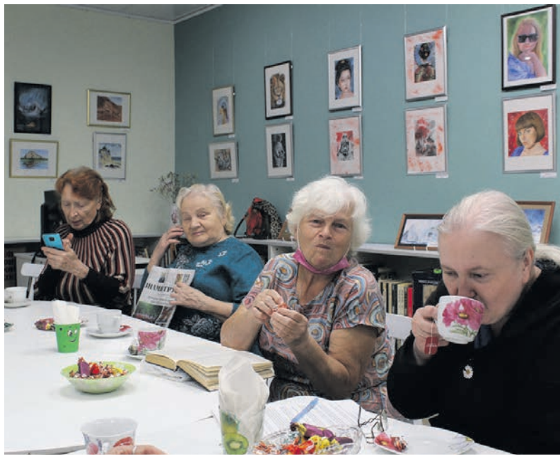
Δ Участники клуба «Жизнелюб» в Сланцевской библиотеке

Но самое главное, что присутствовало на встрече, – тёплая атмосфера, дружеское общение, непринуждённый разговор, веселье, отличное настроение. «Жизнелюбы» ещё раз доказали, что они бодры, жизнерадостны и молоды душой.