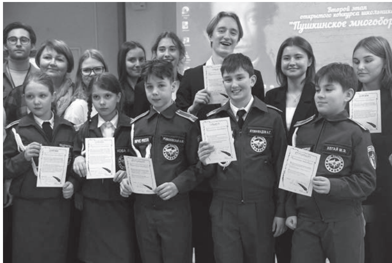
Д Команда Сланцевского района – участники Всероссийского конкурса «Пушкинское многоборье»