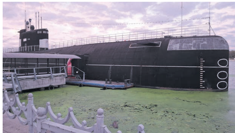
▲ Подводная лодка Б-396 «Новосибирский комсомолец» находится в Москве в парке «Северное Тушино» на берегу Химкинского водохранилища