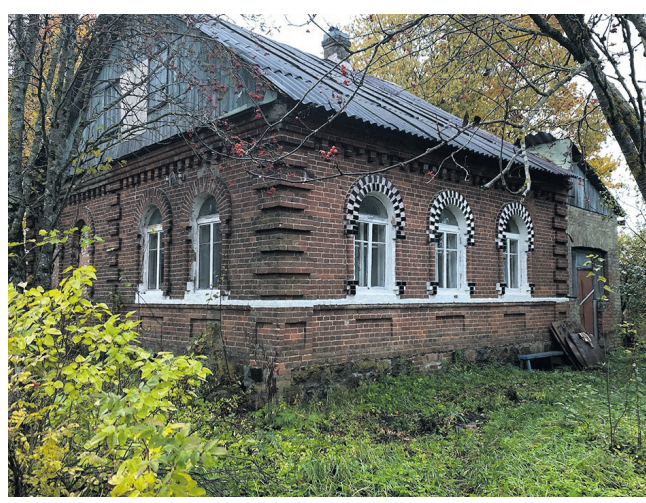
Δ Дом Героя Советского Союза Андреева Николая Родионовича

В последние десятилетия наблюдается тенденция оттока населения из деревень в города. Причины этого явления многогранны. Но маленькие деревни – такие, как Кологриво, – обладают уникальными чертами и преимуществами, которые делают их привлекательными для жизни. Что же ждёт эту деревеньку в ближайшем будущем?