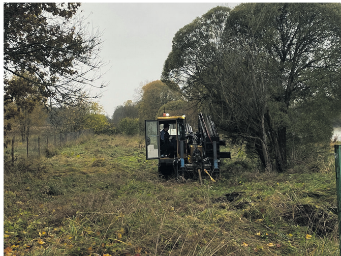
Δ В деревне Кологриво началась прокладка газопровода