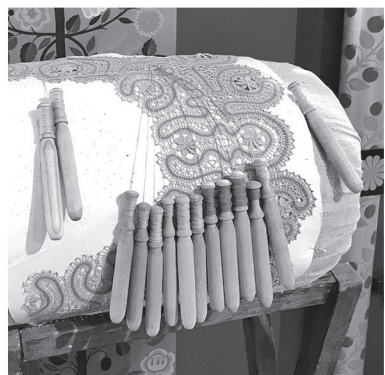
Деревянные коклюшки для плетения кружева

КУРЬЯ ЛАПА — УЗОР С ФИГУРОЙ ИЗ 3 «ПАЛЬЦЕВ»