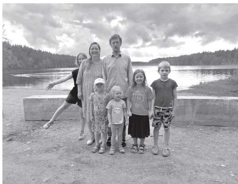
Совместные путешествия — любимая семейная традиция Ельцовых