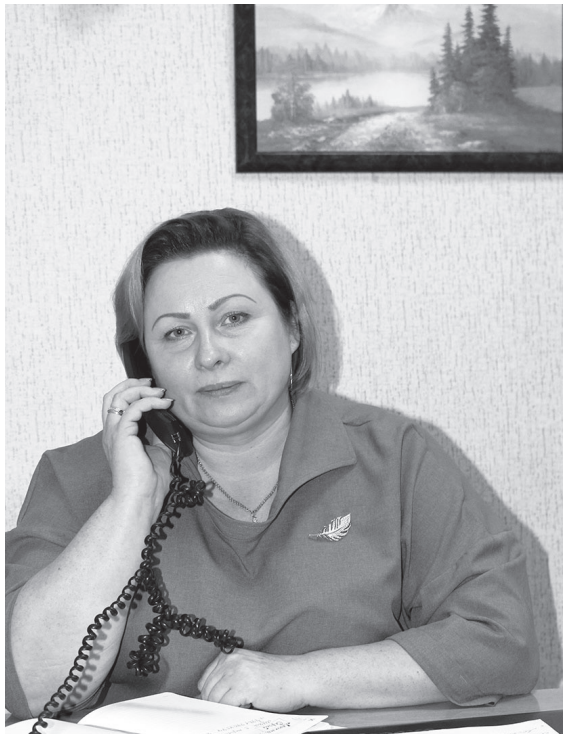
Д Марина Борисовна Чистова, глава администрации Сланцевского муниципального района

Ещё один вопрос от жителей этого дома касался месторасположения контейнера для сбора ТКО. Согласно реестру мест накопления твёрдых коммунальных отходов, расположенных на территории Сланцевского городского поселения, контейнерная площадка, расположенная по адресу: г. Сланцы, пр.