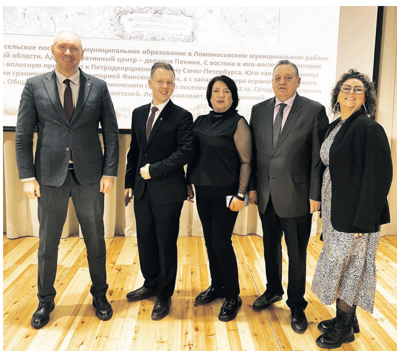
Депутаты Сланцевского городского поселения на заседании «Муниципальной школы»

На занятиях участники смогли ознакомиться с правовыми аспектами организации местного самоуправления, получить информационную, консультационную и методическую поддержку в этой области, а также обменяться опытом.