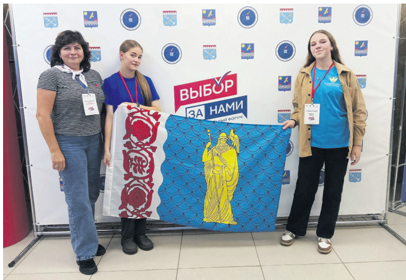
Делегация Сланцевского района на межрегиональном форуме по гражданско-патриотическому воспитанию молодёжи «Выбор за нами!»

Режиссёр, автор документального кино и социальной