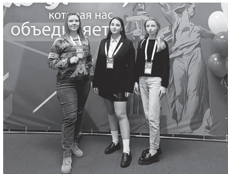
Δ Сланцевская делегация на открытии регионального Центра подготовки волонтёрского корпуса 80-летия Победы в Великой Отечественной войне

– Замечательное мероприятие. Мы должны помнить историю своей страны, своих предков. Считаю важным, что для подростков и молодёжи на сегодняшний день создаётся столько различных проектов. Ведь именно благодаря этому мы можем развиваться и идти