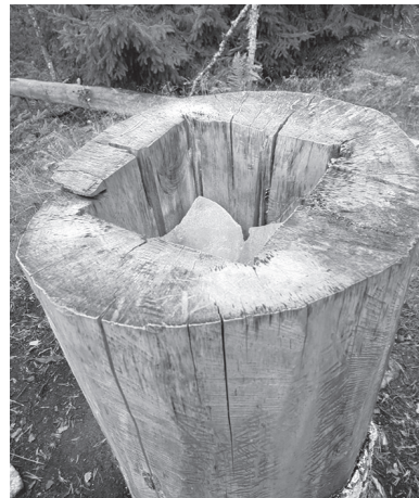
Солонец — лесная подкормка для лосей

КСЕНИЯ БОНДАРЕНКО