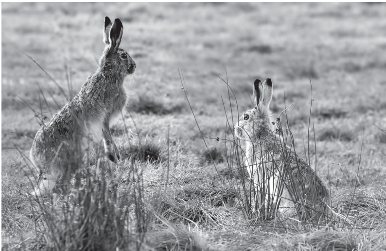
Ведомство ведёт учёт животных, обитающих в ленинградских лесах