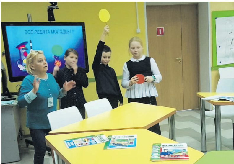
Дети играют в «Светофор» в Сланцевской детской библиотеке

Ученики коррекционного 3-го класса МОУ «ССОШ № 6» стали участниками тематической встречи в Сланцевской детской библиотеке, посвященной Правилам дорожного движения (ПДД).