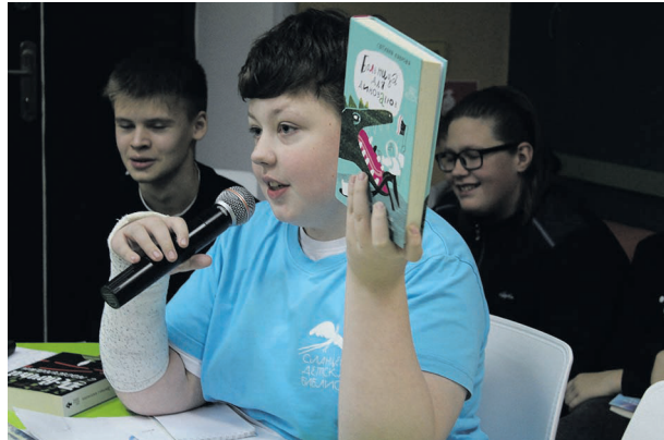
△ Лидер чтения говорит о книгах