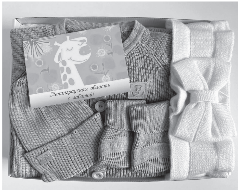
Подарочный набор в рамках акции «Ленинградская область с заботой»

В РАМКАХ АКЦИИ «ЛЕНИНГРАДСКАЯ ОБЛАСТЬ С ЗАБОТОЙ» 115 СЕМЕЙ ПОЛУЧИЛИ ДОПОЛНИТЕЛЬНЫЙ ПОДАРОЧНЫЙ НАБОР