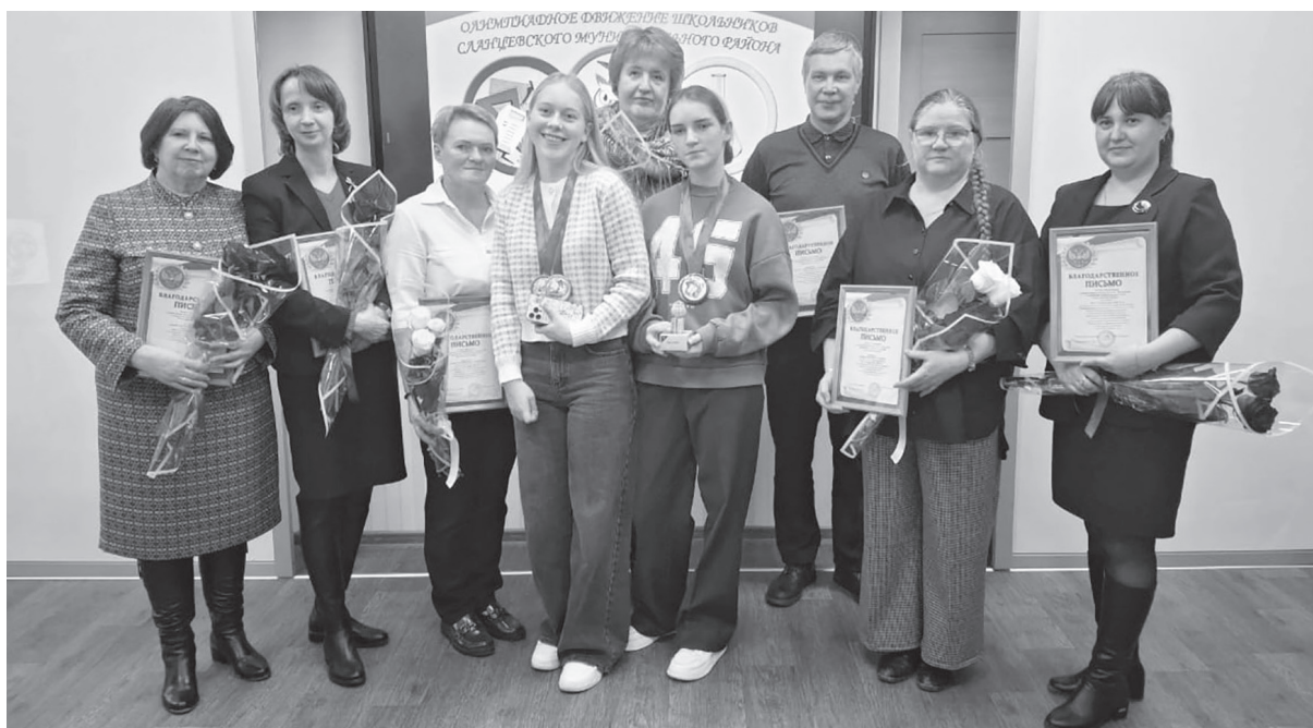
Δ Самая результативная в предметных олимпиадах 2023-2024 учебного года – школа № 1

Подведены итоги участия в предметных олимпиадах и среди образовательных организаций. В 2023-2024 учебном году три образовательные организации шли, можно сказать, друг за другом. Третье место в рейтинге школ заняла МОУ «Сланцевская СОШ № 6». Эта образовательная организация подготовила 18 победителей и 19 призёров олимпиад на муниципальном уровне, одного призёра на заключительном этапе региональной олимпиады школьников. В сумме 38 победителей! Второе место в рейтинге школ заняла МОУ «Сланцевская СОШ № 3». Эта образовательная организация подготовила 21 победителя