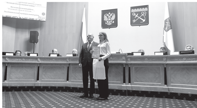
Участниками конкурса стали 38 семей со всей Ленинградской области