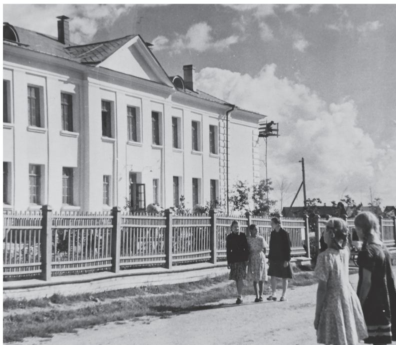
Школа № 1 в 1952 году

Продолжение следует. (По материалам газетных и журнальных публикаций разных лет, а также Интернет-ресурсов – составила сотрудник Сланцевской библиотеки Т.А. ПАВЛОВА).