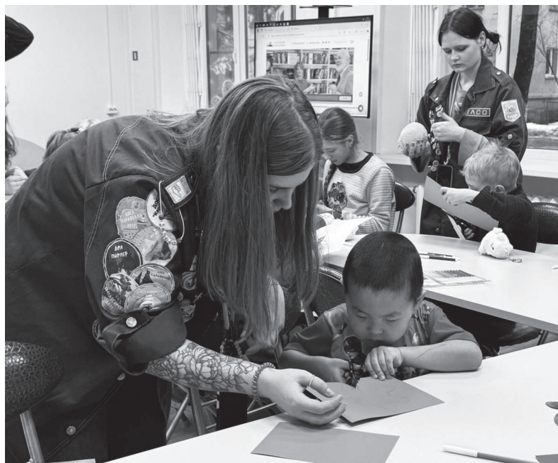
Дети делают поделки под руководством волонтеров

Особое внимание будет уделено подготовке концерта по мотивам популярного мультфильма «Летучий корабль». Отряд планирует пробыть в Сланцевском районе до 1 февраля включительно. Одной из отличительных черт отряда «Дыхание» является разнообразие профессиональных компетенций его участников. Среди