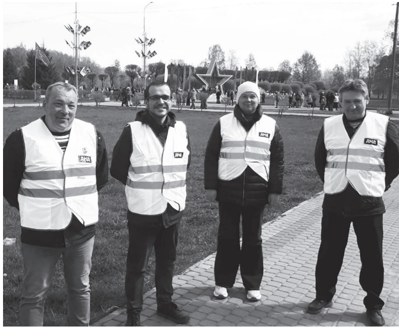
Добровольные народные дружинники Сланцевского района

– Всеми ДНД подписаны трёхсторонние соглашения о взаимодействии с администрациями Сланцевского района и ОМВД России по Сланцевскому району о взаимодействии при выполнении мероприятий по охране общественного порядка на территории Сланцевско-