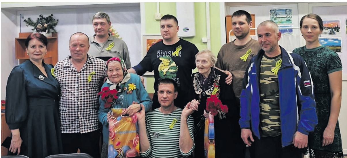
Участники встречи «От героя к герою» в Сланцевском Доме-интернате

Бойцы тепло поздравили ветеранов – жителей блокадного Ленинграда и поблагодарили за подвиг, стойкость, силу духа и жизнелюбие, которые помогли им пройти через невероятные испытания и завоевать Великую Победу!