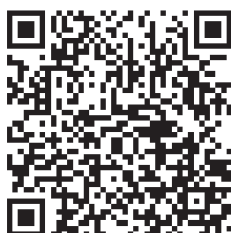
Видео Юрия Терентьева ВКонтакте