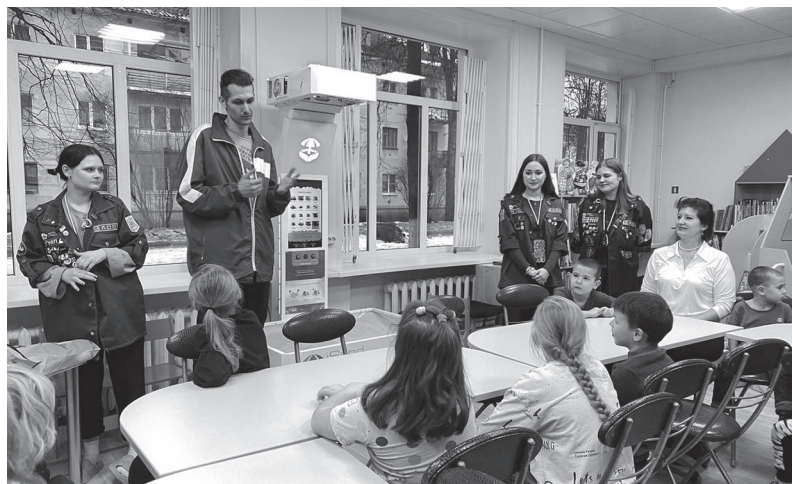
Участники отряда «Дыхание» в библиотеке в Лучках