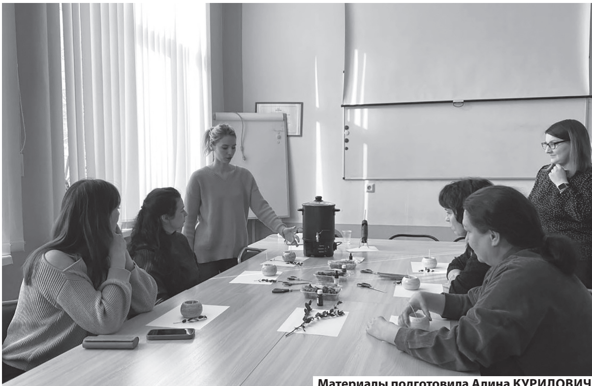
Материалы подготовила Алина КУРИЛОВИЧ.

Немаловажно отметить, что мероприятие не ограничивалось лишь мастер-классом. Важной составляющей стала нетворкинг-сессия, предоставившая участникам возможность расширить круг деловых знакомств, обсудить насущные вопросы и вместе искать решения актуальных проблем. Предприниматели отметили, что подобные встречи позволяют им посмотреть на свою работу под новым углом, выйти за рамки привычного и найти свежие идеи для дальнейшего развития 47