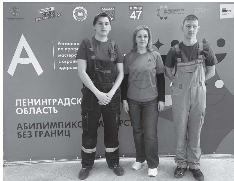
Участники чемпионата по компетенции «Сухое строительство и штукатурные работы»

ментов с юбкой-брюками, оригинальность элемента.