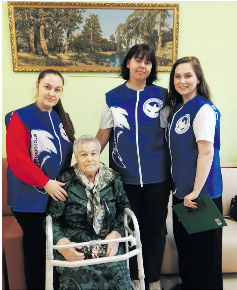
Волонтеры Победы собирают воспоминания у ветеранов ВОВ в Сланцевском районе.

Волонтерский корпус акции в Сланцевском районе на 2025 год составляет более 70 человек из числа неравнодушных жителей города, зарегистрированных на Всероссийской платформе www.dobro.ru Основная задача волонтеров – непрерывная связь, позволяющая мониторить потребности семьи, по возможности оказывать помощь или направлять для решения в компетентные органы. По поручению губернатора Ленинградской области организованы поздравления членов семей