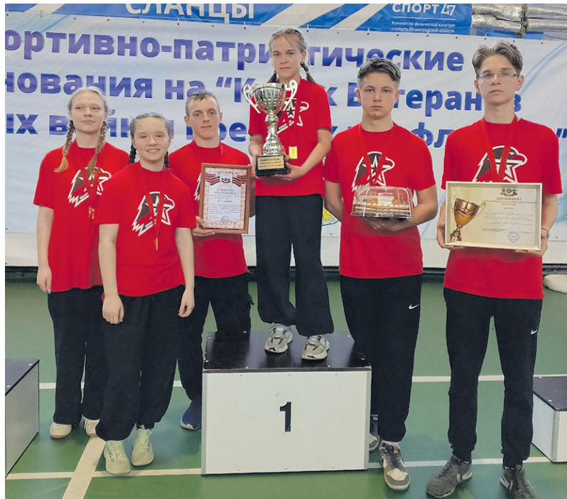
Победители соревнований отряд «Андреевцы» МОУ «Старопольская СОШ»

Спортивное мероприятие «Спортивно-патриотические соревнования на переходящий «Кубок Ветеранов локальных войн и военных конфликтов Сланцевского муниципального района» прошло в МКУ «ФОК СМР» в минувшую пятницу. Оно было приурочено к шестнадцатой годовщине окончания контртеррористической операции в Чеченской республике. Команды из семи образовательных организаций состязались в силе, выносливости, ловкости, скорости и командной работе.