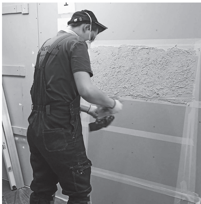
Площадка по компетенции «Сухое строительство и штукатурные работы»