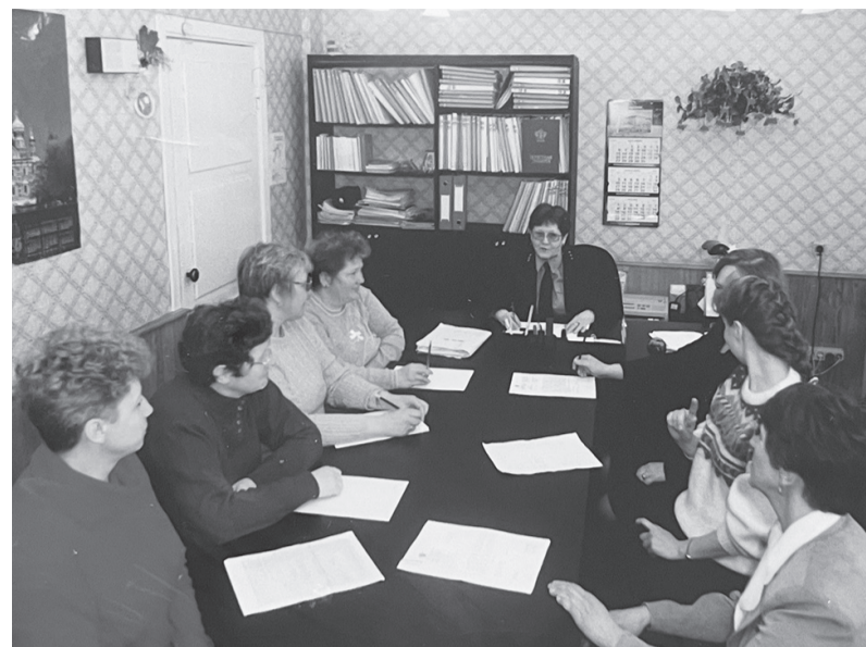
■ Рабочее совещание начальников отделов Налоговой инспекции по Сланцевскому району в 90-х годах