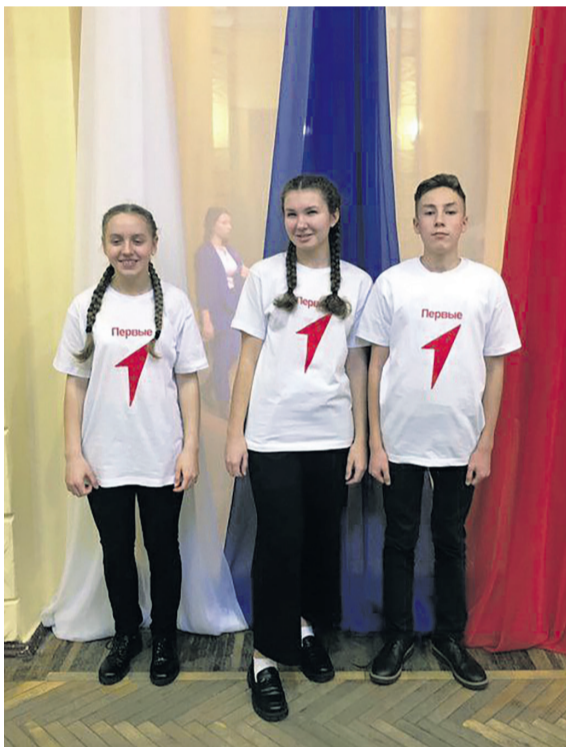
Посвящение в участники «Движения Первых»

– У меня нет каких-то конкретных личных целей в волонтерстве, потому что для меня это не про достижения или выгоду. Волонтерство – это, в первую очередь, про помощь людям, своему городу и Отечеству. Я просто стараюсь выкладываться на полную, делать всё от себя зависящее ради общего блага и благополучия нашей страны.