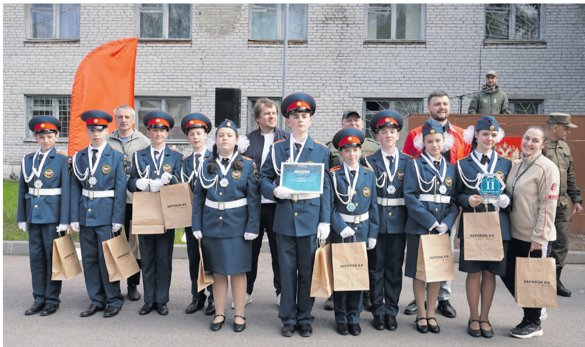
Победитель регионального этапа «Зарница 2.0», команда «Патриот» МОУ «Сланцевская СОШ №6»

Заключительный, третий день соревнований «Зарница 2.0» стал кульминацией тактического мастерства и стратегического мышления. Юным патриотам предстояло принять участие в сложнейшей тактической игре на местности, где каждая команда должна была продемонстрировать не только физическую подготовку, но и исключительное умение принимать верные и быстрые решения в условиях, максимально приближенных к реальным. Эта комплексная игра в лазертаг состояла из трёх динамичных и требовательных дисциплин: «Захват контрольных точек», где проверялись навыки оперативного планирования и координации; игра «Атака – оборона», моделирующая наступательные и оборонительные действия с элементами маневрирования; и «Встречный бой», требующий мгновенной реакции и способности к адаптации в условиях внезапного столкновения. Несмотря на высочайший уровень конкуренции и серьёзность испытаний, команда «Патриот» из Сланцевского района показала достойный результат, заняв почётное третье общекомандное место в этой решающей тактической битве.