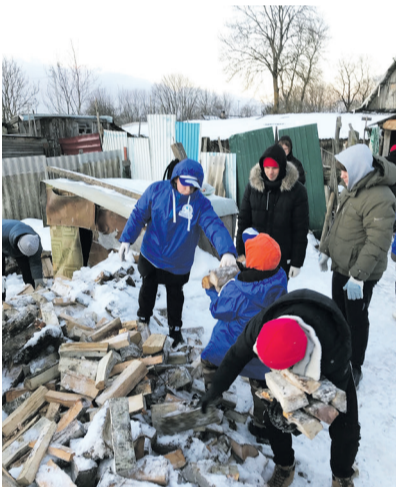
Волонтеры Победы совместно с Юнармейцами Сланцевского района помогли в заготовке дров семье участника СВО.

– Штаб #МЫВМЕСТЕ в Сланцах начал работу ещё во время пандемии. Тогда волонтеры доставляли лекарства и продукты пожилым людям. После завершения той волны, движение не только не остановилось, но и обрело новое направление – сопровождение семей СВО. Сегодня эта помощь жизненно важна, и с каждым днём к ней присоединяются всё новые неравнодушные жители. В здании Молодёжного центра также организован пункт приёма гуманитарной помощи, куда каждый может принести нужные вещи, продукты, средства гигиены и передать их тем, кто в этом особенно нуждается.