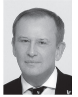
АЛЕКСАНДР ДРОЗДЕНКО, ГУБЕРНАТОР ЛЕНИНГРАДСКОЙ ОБЛАСТИ

642 года назад, на берегу реки Тихвинки впервые явилась икона Божией Матери, ставшая чудотворной. Тихвинская икона стала хранительницей Северо-Западных рубежей России. Укрепляются православная вера, Россия и Тихвинский Богородичный Успенский монастырь.