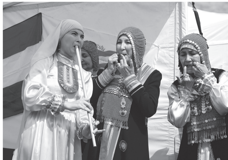
Национальность — это принадлежность к этнической группе с уникальными традициями и культурой

— Я ещё с детства помню, что в деревенском Сабантуе ни-