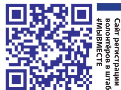
Сайт регистрации волонтеров в штаб #МЫВМЕСТЕ

Проект реализуется при поддержке Комитета по печати Ленинградской области.