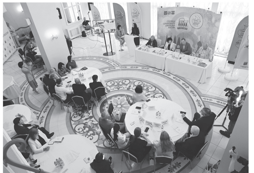
Торжественная церемония передачи статуса столицы проекта «Серебряное ожерелье России»

В городе появится первый интерактивный музей музыки в отреставрированном Доме культуры, новый выставочный павильон на базе музея Римского-Корсакова, где представят лучшие музеи России: Русский музей, Третьяковскую галерею и другие. Не останется в стороне и ин-