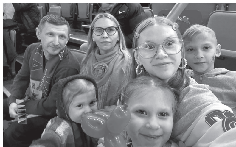
Дети — это такое большое счастье! И чем их больше, тем больше счастья!

ТАТЬЯНА ЧУМЕРИНА