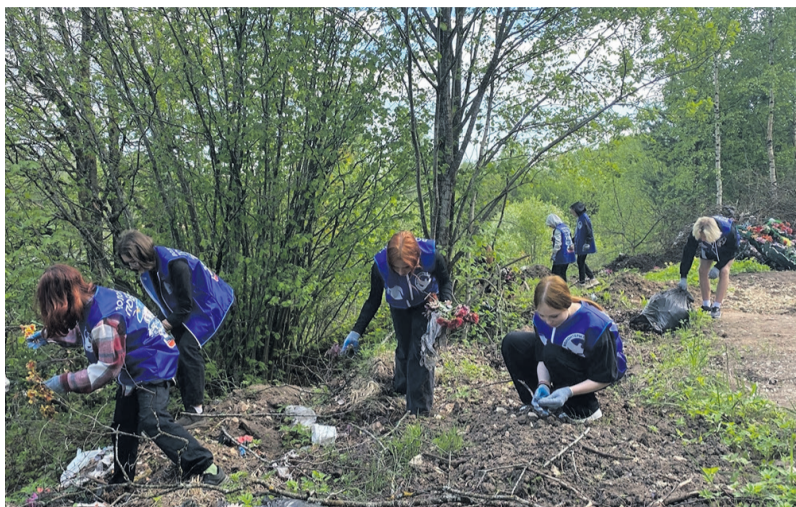
Волонтеры Победы Сланцевского района, по просьбе родственников погибшего военнослужащего, помогли убрать мусор с территории воинского захоронения участника СВО.

Сопровождение семей участников СВО – важное направление добровольчества.