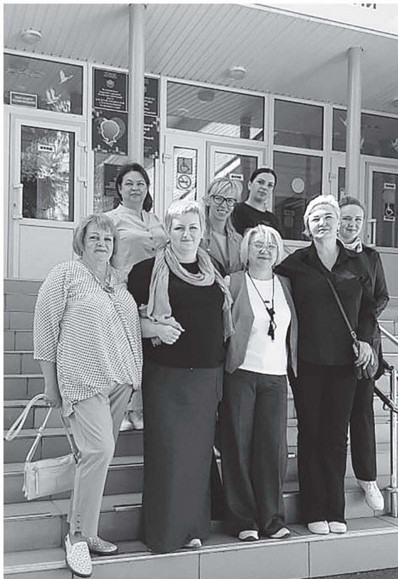
Специалисты центра «Мечта» с коллегами из Тихвина

В нашем центре выездная служба «Домашний консультант» работает активно, специалисты побывали почти во всех сельских поселениях. Они провели диагностические процедуры и проконсультировали родителей детей раннего возраста. Если Вы воспитываете ребёнка от 0 до 3 лет с особенностями в развитии, проживаете в сельской местности и не имеете возможности получать услуги ранней помощи в нашем учреждении – обратитесь в выездную службу «Домашний консультант», телефоны для справки 8(81374)-43287, 8(81374) – 32055. 47