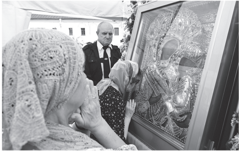
Количество людей, регулярно приходящих помолиться Божией Матери, показывает, какой огромный отклик она находит в их сердцах

Крестный ход — это испытание, но вместе с соборной молитвой и литургией под открытым небом — полезное для православных. Я так хожу уже третий раз, — поделилась своим опытом Мария, паломница из Приозерска.