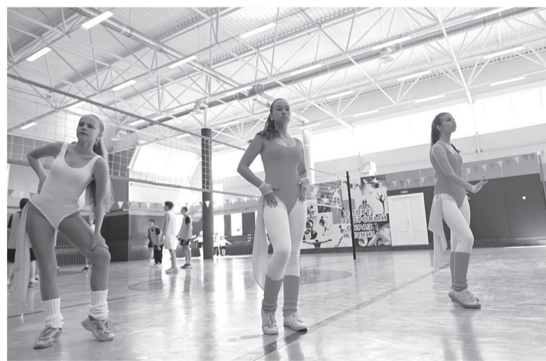
Спортсменки Лодейного Поля показывают «чемпионские результаты» в разных видах соревнований

Следующей остановкой губернатора стал город Лодейное Поле, где полным ходом идёт капремонт местной спортивной школы в рамках госпрограммы «Развитие физической культуры и спорта в Ленинградской области». Сейчас строительная готовность объекта составляет 40%. Именно в этой школе тренируется женская команда «Ленинградцев», официальный филиал региональной футбольной школы. Местные спортсменки пока-