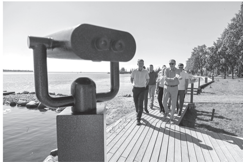
Набережная Свири в посёлке Вознесенье превращается в курортный бульвар

Губернатор также посетил деревообрабатывающий завод ООО «ВЛП Свирь», который смог преодолеть санкционный кризис. С 2022 года предприятие входит в состав АО «Группа компаний „Вологодские лесопромышленники“», ранее оно принадлежало финской компании. Под новым именем завод начал работу в 2024 году и быстро вернул себе статус одного из передовых в России производств европейского уровня по выпуску пиломатериалов. Здесь ежегодно выпускают 270 тыс. м 3 готовой продукции и перерабатывают до 500 тыс. м 3 древесины. Благодаря заводу на рынок поступает более 140 тыс. м 3 технологической щепы, 90 тыс. м 3