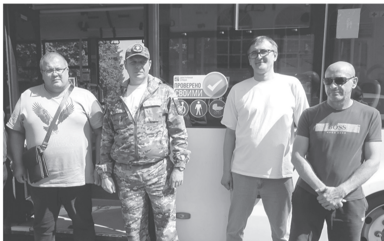
Важно, чтобы учебные заведения были доступны для людей с ограниченными возможностями здоровья

Ветераны специальной военной операции проверили социальную и транспортную инфраструктуру в Гатчине на доступность для людей с инвалидностью. Знак «Проверено СВОими» получили четыре из пяти протестированных объектов.