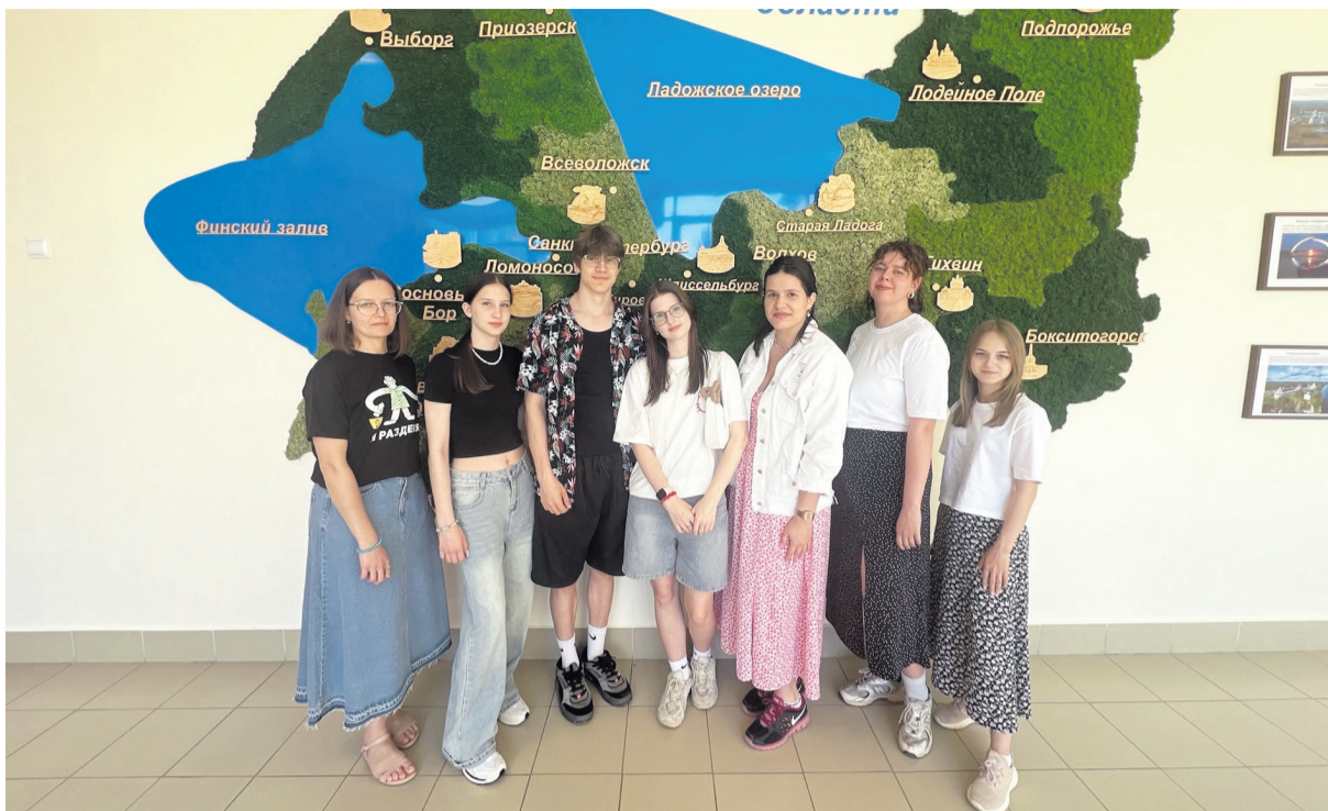
Делегация Сланцевского района на обучающем семинаре в пгт Толмачёво Лужского района

В Ленинградской области реализуется много масштабных инфраструктурных и промышленных проектов, которые важны для региона и страны. Экология – одна из якорных тем, способных консолидировать общественные интересы и направить молодую энергию в конструктивное развитие общественных отношений.