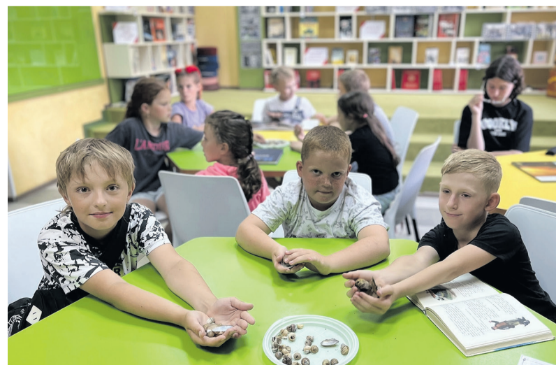
Материалы подготовила Юлия ЛЕБЕДЕВА.

Вторая смена лагеря «Апельсин» подходит к концу, но впереди ещё много интересного! Желаем всем отличного настроения, захватывающих приключений и прекрасного отдыха в последний месяц лета!