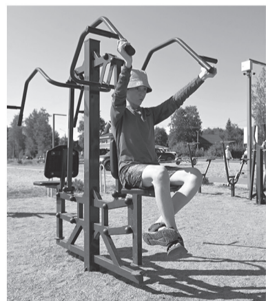
Физкультура на свежем воздухе

Первой его остановкой стал посёлок Вознесенье на границе с Карелией и Вологодской областью. Здесь недавно в рамках нацпроекта «Инфраструктура для жизни» по программе «Формирование комфортной городской среды» проведено благоустройство Свирской набережной. Теперь это место для отдыха и досуга местных жителей, а также площадка для проведения мероприятий. Вдоль набережной созданы пешеходные маршруты, зоны отдыха и положен деревянный настил. Для юных ленинградцев оборудовали площадку с нестандартной палео-песочницей, а для всех любителей флоры и фауны появилась возможность наблюдать за птицами в специальной зоне. Губернатор отметил, что вокруг гуляет много людей, а это значит, что новое общественное пространство привлекает население.