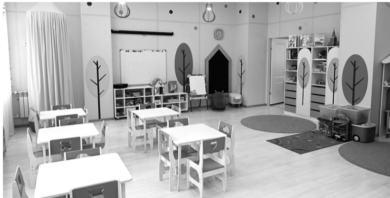
Новые школы и садики строятся в Ленобласти по нацпроекту «Образование»

РЕГИОН УСПЕШНО РЕАЛИЗУЕТ НАЦИОНАЛЬНЫЕ ПРОЕКТЫ В РАЙОНАХ И НЕ ПЛАНИРУЕТ ОСТАНАВЛИВАТЬСЯ