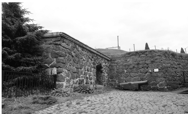
Бастион Панцерлак XVI века