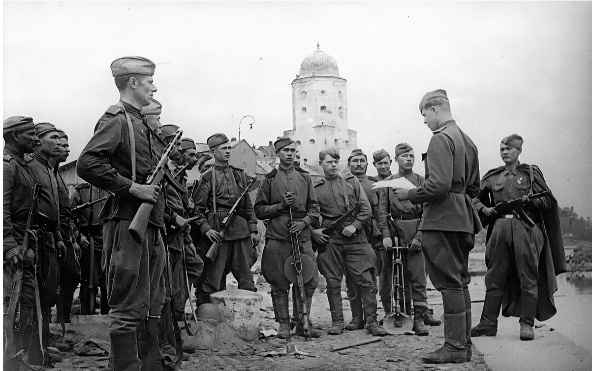
Советские войска освободили Выборг 20 июня 1944 года