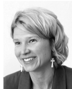
ОКСАНА ЛУТ, МИНИСТР СЕЛЬСКОГО ХОЗЯЙСТВА РОССИЙСКОЙ ФЕДЕРАЦИИ

А техника была загляденье: предприятия из России и других стран выставили множество технологических новинок — тракторов, комбайнов, поливальных и уборочных машин. Это вызывает интерес не только у профессионалов АПК, но и у обычных посетителей, особенно у детей. Всем интересно потрогать красивый трактор и сфотографироваться. Можно даже за-