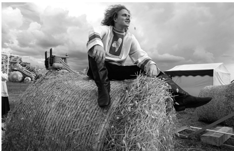
Сено — это не только еда для коров, но и неременный атрибут скромной сельской романтики

Обновление парка техники — одна из ключевых задач, от которой зависят в том числе объёмы и качество растениеводческой продукции, эффективность агробизнеса. С каждым годом ассортимент сельхозтехники увеличивается, повышаются её производительность и другие важные функциональные требования. В этом году аграрии закупили 18 тыс. единиц новой техники, из них больше половины — с господдержкой Росагролизинга.