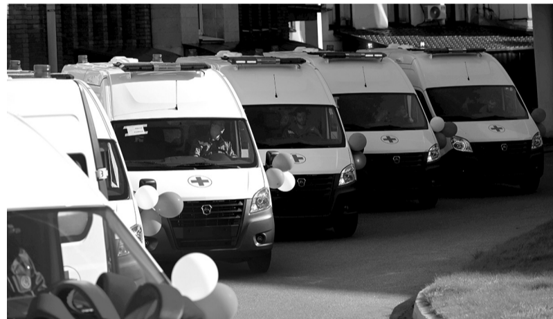
Для жителей 47-го региона переход на ЕМИС пройдёт максимально гладко

Скорость принятия врачебных решений, измеряемая минутами, а не днями, электронный больничный за два клика и скоординированная помощь, где каждый специалист видит полную картину здоровья пациента, — это первые результаты перехода на Единую медицинскую информационную систему (ЕМИС). Масштабный проект, реализуемый по поручению президента РФ, кардинально меняет работу врачей и качество обслуживания для более чем 860 тысяч ленинградцев, уже пользующихся цифровыми сервисами.