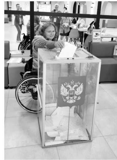
Доступная среда на избирательных участках

— От этого выбора зависит будущее не только нашего региона, но и будущее каждой ле-