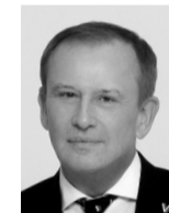
АЛЕКСАНДР ДРОЗДЕНКО, ГУБЕРНАТОР ЛЕНИНГРАДСКОЙ ОБЛАСТИ

ЮЛИЯ ЛИСНЯНСКАЯ