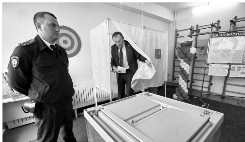
Александр Дрозденко проголосовал по месту жительства в Лупполово на участке № 131

Всего к выборам губернатора Ленобласти сразу в шести российских регионах были сформированы экстерриториальные избирательные участки: в Москве, Петербурге, а также в Донецкой и Луганской Народных Республиках, Запорожской и Херсонской областях.