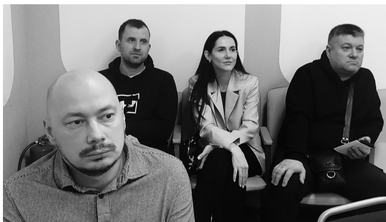
Участники встречи, посвящённой развитию креативных индустрий в Фонде поддержки предпринимательства

Отдельное внимание было уделено представлению концепции стратегии развития креативных индустрий в Ленинградской области. Специалисты подробно остановились на подходах, которые лежат в основе формирования региональной политики в этой сфере: от создания инфраструктуры для творческих проектов до совершенствования механизмов