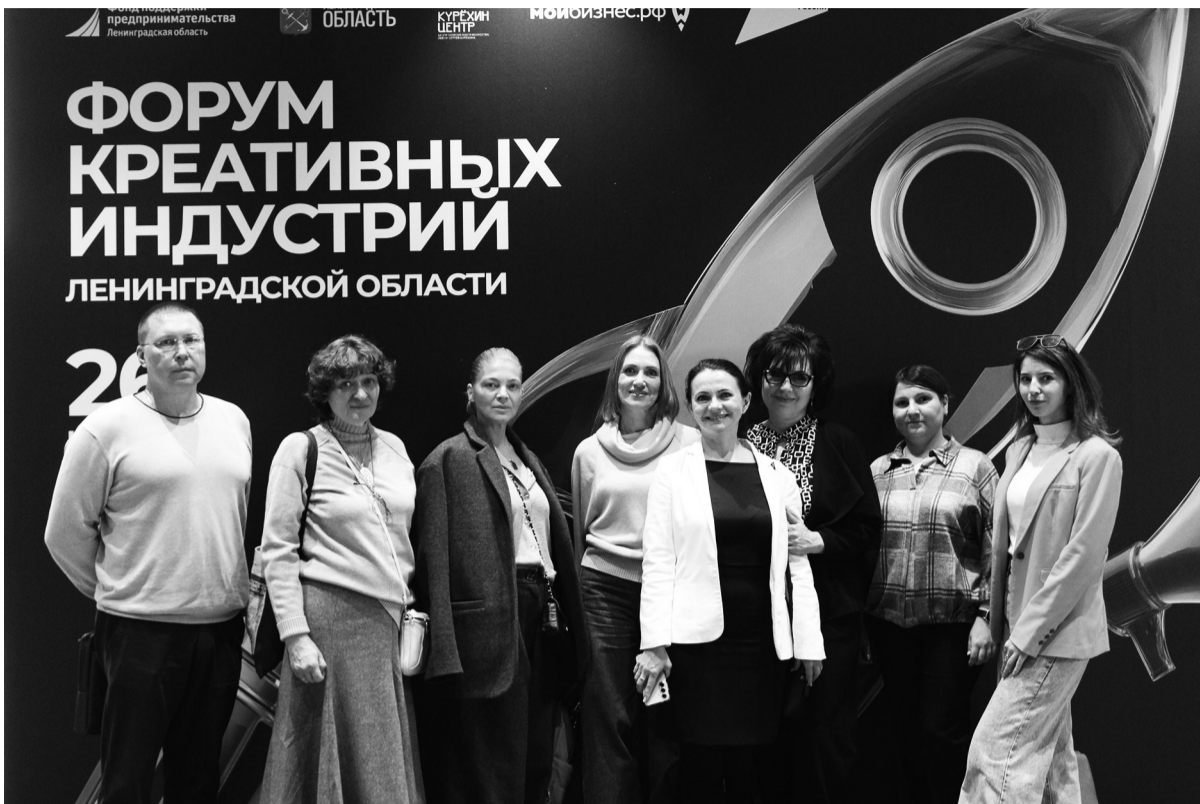
Делегация Сланцевского района на форуме «Мой бизнес: креативные индустрии Ленинградской области»

На площадке форума работала зона «Мой бизнес», где можно было узнать, как вступить в реестр и какие меры поддержки доступны. В числе ближайших инициатив – серия семинаров до конца года и слёт ремесленников, запланированный на начало декабря.