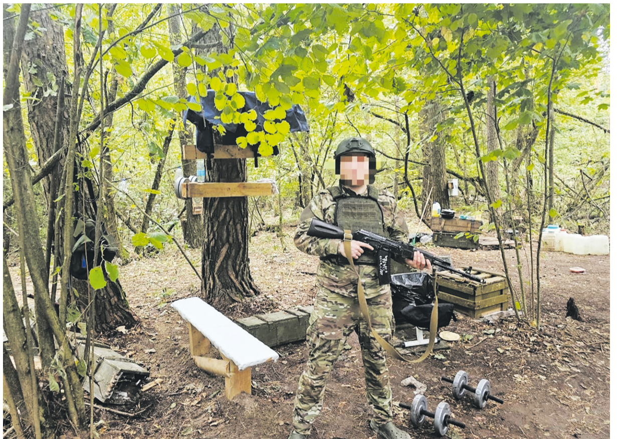
Его позывной Аллигатор, он действующий военнослужащий, уже три года защищает нашу страну

Его история – это пример силы духа и патриотизма, который вдохновляет многих. Через свою службу он стал защитни-