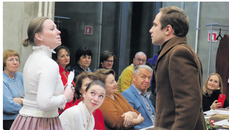
Во время показа краеведческой пьесы «Артист»