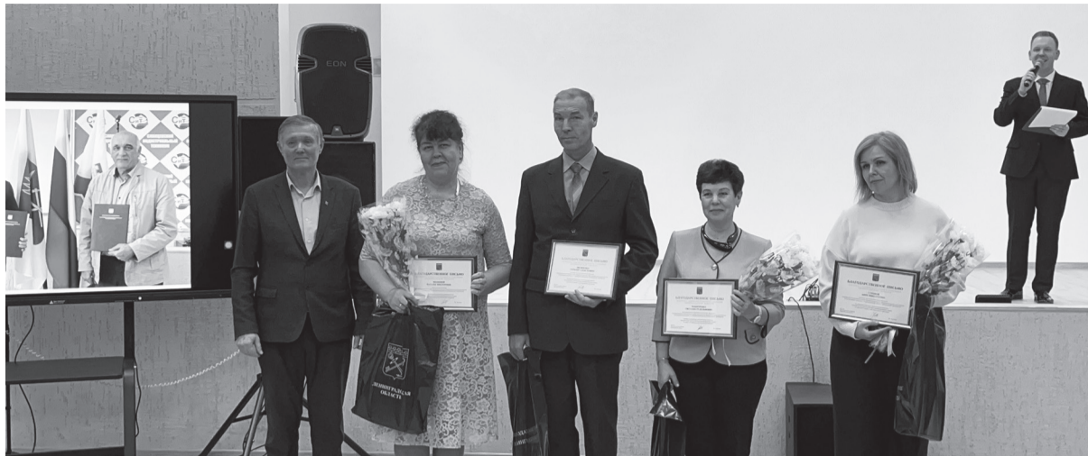
Педагоги Сланцевского индустриального техникума принимают награды от депутата Законодательного собрания Ленобласти В.А. Густова, их вручает его помощник В.Ф. Лебедев

5 декабря состоялось торжественное празднование 65-летия ГБПОУ ЛО «Сланцевский индустриальный техникум».