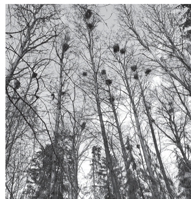
Гнезда в цапельнике

Интересно, что уже не первый год в Ленинградской области обнаруживается несколько мест (в том числе, два — в Гатчинском округе), где серые цапли остаются зимовать. В каждом