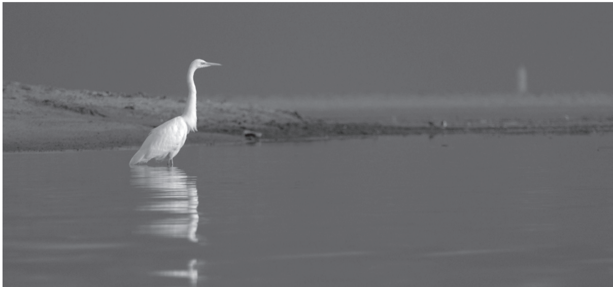
Белая цапля на Финском заливе в Ломоносовском районе Ленинградской области