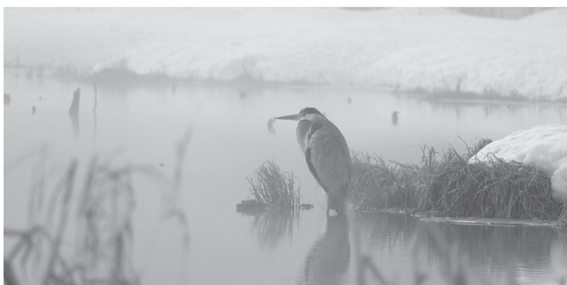
Серая цапля зимой в Гатчинском округе

ПАВЕЛ ГЛАЗКОВ, ТЕЛЕВЕДУЩИЙ, АВТОР КАНАЛА О ЖИВОТНЫХ «КАЖДОЙ ТВАРИ ПО ПАРЕ», КАНДИДАТ БИОЛОГИЧЕСКИХ НАУК