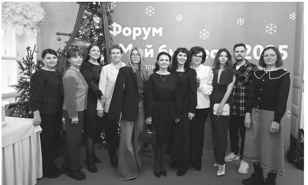
Делегация Сланцевского района на форуме «Мой бизнес» в Гатчинском дворце

Количество субъектов малого и среднего бизнеса в регионе уже превышает 88,5 тысячи. В этих компаниях трудятся около 444 тысяч человек. По сравнению с предыдущими периодами рост составил 33 процента, что свидетельствует о стабильном развитии предпринимательской среды.