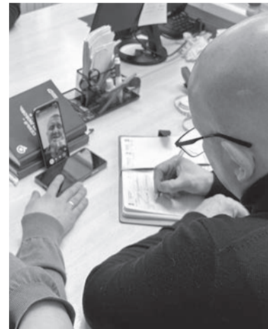
График выездов специалистов ЛОГАУ «Мультипротез»