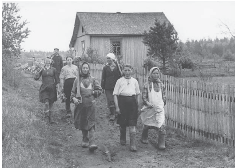
Выборгский район, колхоз им. 1 Мая. Переселенцы из Петровского района Ярославской области выходят на полевые работы, 1946