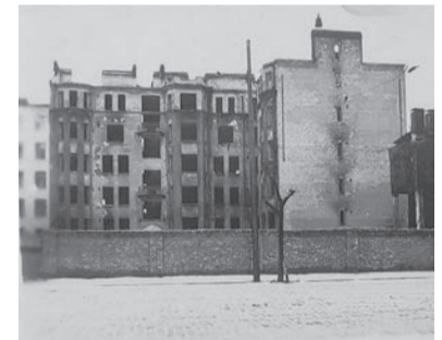
Полуразрушенное здание Сетевязальной фабрики, 1946

Главное же, что увидел Рахул в Выборге — это неотвратимость возвращения к жизни. Некоторые дома уже наскоро отремонтированы и заселены. На въезде в город работал новый «огромный механизированный завод по производству бетона» — символ строительства. «Война нанесла большой ущерб, но, кроме десяти процентов заселённых домов, ещё пятьдесят процентов можно было легко заселить. Придётся отремонтировать только их окна, двери и крыши», — писал он, и в этих словах звучал расчёт на быстрое восстановление.