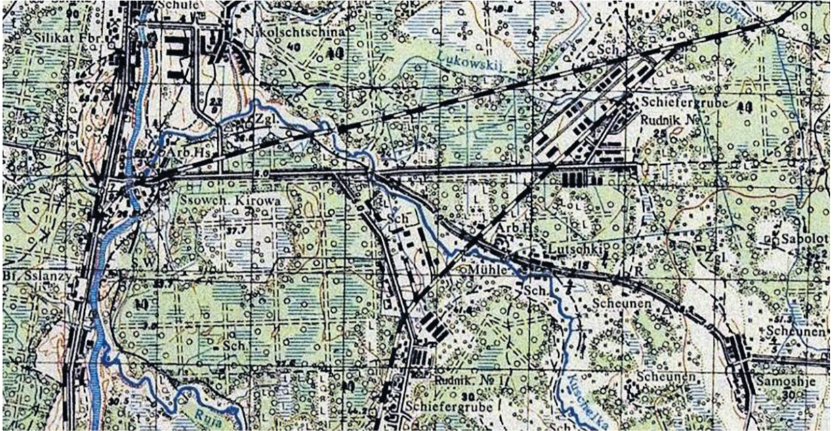
Рудник № 2 на немецкой карте Сланцев 1940-х гг.