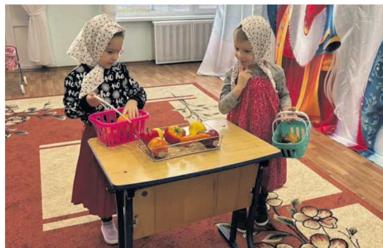
Материалы подготовила Татьяна КРЫЛОВА.