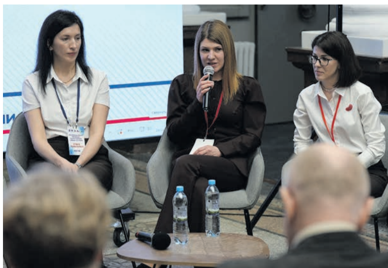
Во время брифинга на Ленинградском областном конкурсе профессионального педагогического мастерства – 2026.

Вечером того же дня должны были объявить результаты. Когда назвали мою фамилию и сказали, что я прохожу дальше, эмоции захлестнули с головой. Радость перемешалась со страхом – ведь впереди новый день и новые испытания. Следующий день был посвящён мастер-классу. Я представляла ав-